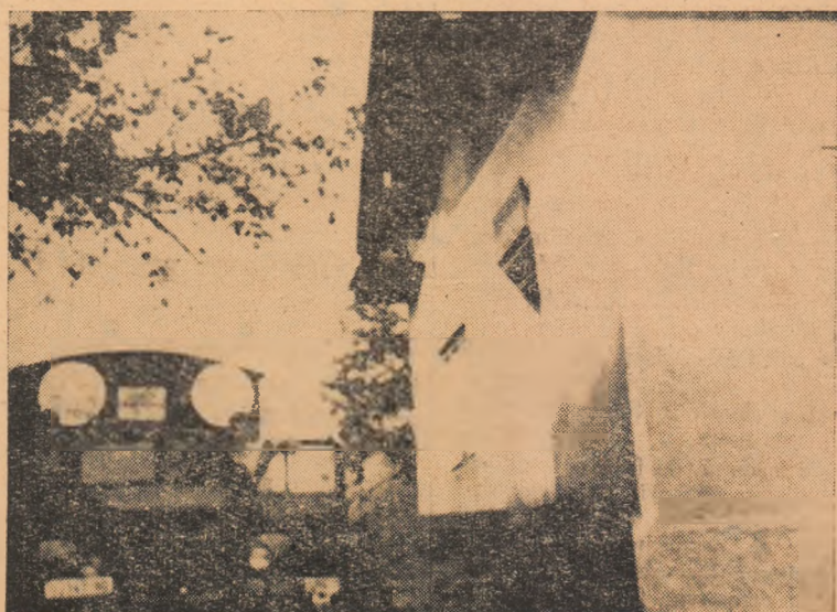
La cîminul cultural din Valea Mică a sosit caravana cinematografică.

Acțiunea pentru asigurarea furajelor necesare animalelor este o sarcină ce nu suferă nici o aminare. În toate gospodăriile colective consiliile de conducere, cu sprijinul organizațiilor de bază, au datorita de a lua asemenea măsuri ca întreaga cantitate de siloz prevăzută să fie realizată. Ce se mai așteaptă la Mihalț, la Ighiu și Benic, la Galtiu, cînd au toate condițiile să insilozeze atît porumbul, care a ajuns deja în faza de coacere lapte-țeară cît și alte ierbururi? La Galtiu se pot insiloza diferite rogozuri și păpuriș. De ce nu se trece concret la muncă? Trebuie, de asemenea, grăbită acțiunea de recoltare a frunzelor și aranjarea lor în frunzare. În această direcție sînt foarte mari rezerve în fiecare comună și sat. Trebuie însă luate măsuri ca aceste rezerve să fie folosite. Comitetele comunale de partid, sfaturile populare comunale au datorita de a sprijini concret acțiunea de insilozare, astfel ca în cel mai scurt timp să se asigure toate cantitățile de siloz planificate.