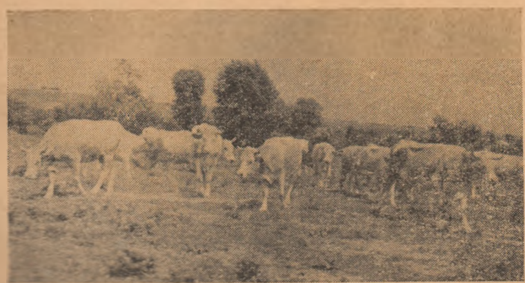
Comuna colectivă de Stremț acordă toată atenția creșterii vacilor.