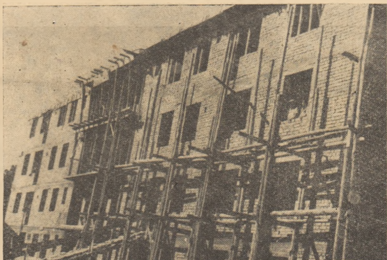
Constructorii de la grupul de șantier T.R.C.H. din Alba Iulia au reușit printr-o muncă însuflețită să termine în roșu blocul Nr. 2 din Alba Iulia cu 15 zile înainte de termen și lucrează acum la tencușii și finisare.

★ la cinematograful „Victoria” rulează filmul sovietic „Omul amfibie”, iar la cinematograful „23 August” — filmul românesc în culori „Nu vreau să mă însor”.