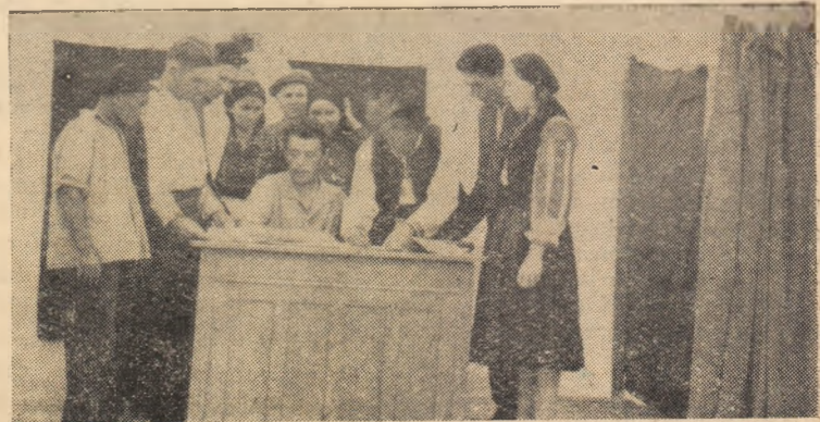
În G.A.C. Ciugud s-au împărțit de curînd avansuri bănești. În clișeu: Aspect de la împărțirea avansului.