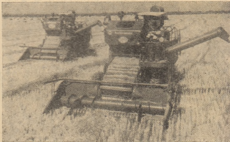
Seceriș pe unul din blocurile cooperatiste din regiunea Plovdiv.

Întreprinderea „Electronica Industrială” din Gabrovo a terminat experimentarea noului generator de lămpi bulgare care va fi expus la cel de al 20-lea fîrg internațional de mostre din Plovdiv. Puterea generatorului este de 250 kw și lucrează pe frecvență de 2500 Herți. Schema noului generator puternic se deosebește printr-o construcție originală care are un coeficient util de folosire de 86 la sută. Problema răcirii generatorului este de asemenea rezolvată în mod original. Acesta are un sistem propriu de răcire cu apă circulară. În felul acesta nu mai este nevoie de pompă de apă specială și de bazinul de răcire.