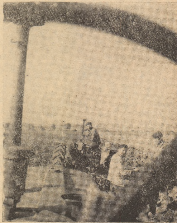
Pe ogoarele gospodăriei colective din Teiuș se lucrează de zor la arăturile pentru însămînțări.

Sunete de clopoțel, flori și copii cu fețele îmbujorate de semnificația zilei. Clipe de emoții și cînt de slavă înălțat partidului. Așa va fi mîine. Și faptul nu va mira pe nimeni. Doar... începe noul an școlar!