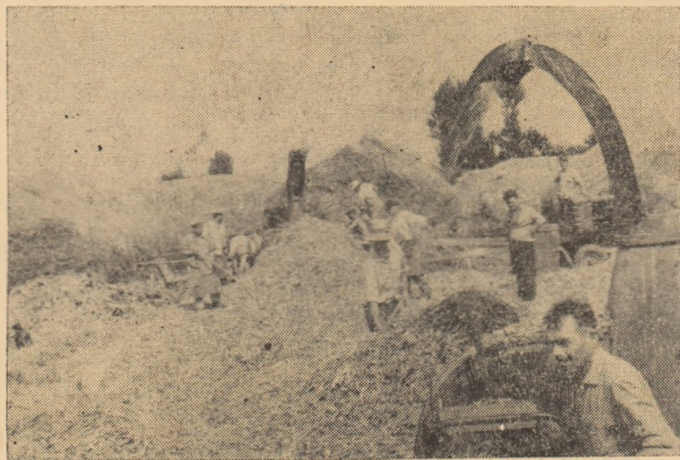
La gospodăria agricolă de stat din Oarda de Jos insilozatul porumbului se desfășoară din plin.

E timpul ca conducerea gospodăriei colective, cu sprijinul sfatului popular, al comitetului comunal de partid, să lichideze de urgență această rămînere în urmă și să mobilizeze toate forțele la insilozat.