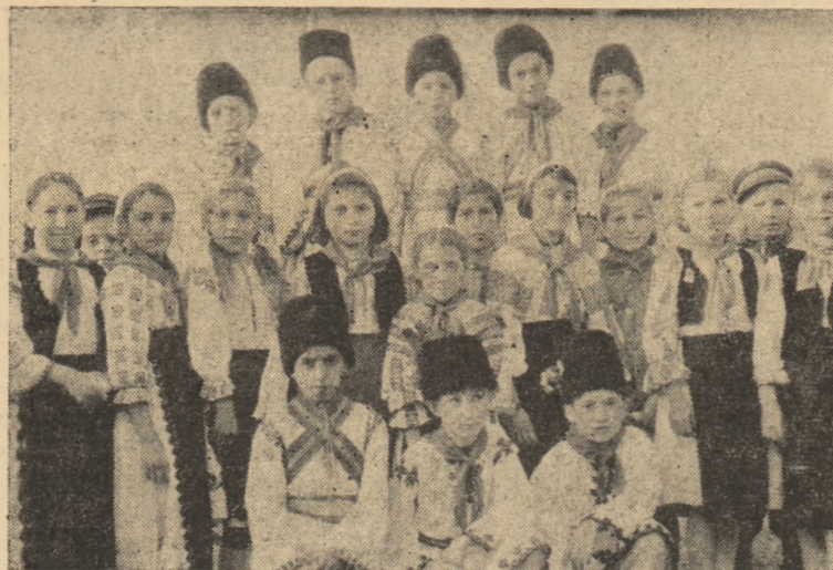
Organizarea de manifestări culturale pe clase a devenit o tradiție la Școala de 8 ani din Micești. În clișeu: Elevii clasei a IV-a înainte de a ieși pe scenă.