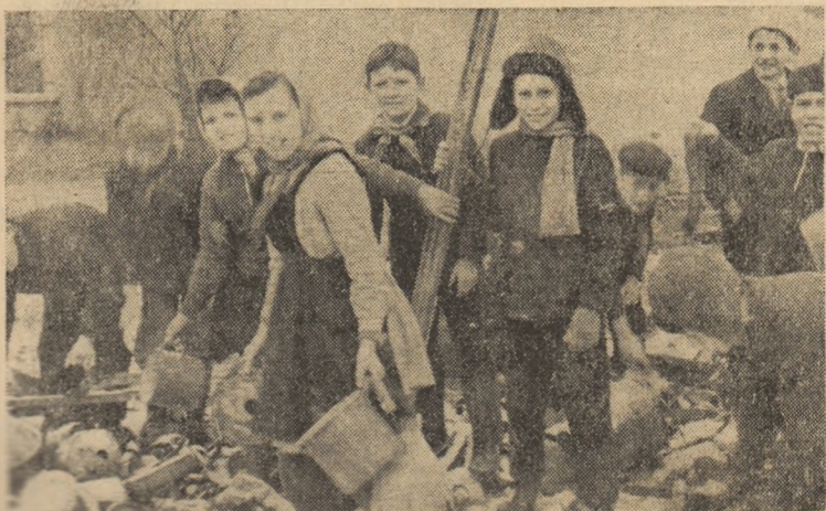
Tot mai mult fier vechi otelării! Aceasta este lozinca care-i îndrumă pe elevii Școlii de 8 ani nr. 1 din Alba Iulia în acțiunile colectarea metalelor vechi.