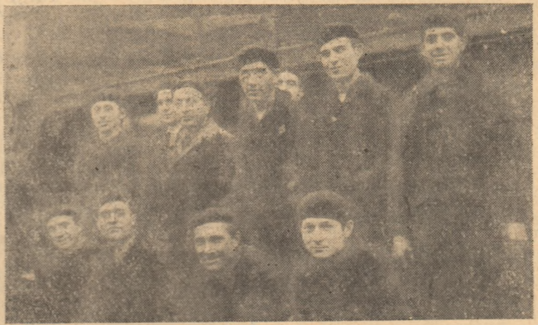
Membrii echipei complexe de la R. R. — Depoul C.F.R. Teiuș — raportează: Locomotiva Nr. 230.017, reparată de ei peste plan, gata pentru cursa de probă.