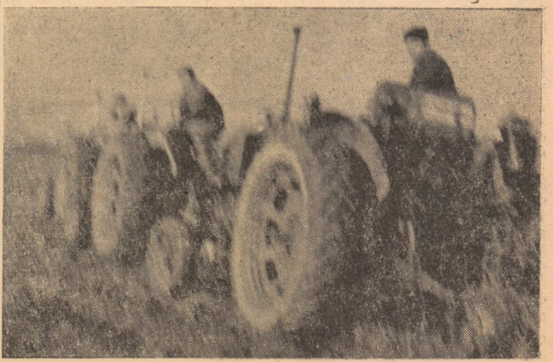
După o absență de cîteva săptămîni, tractoarele au ieșit din nou la arat.