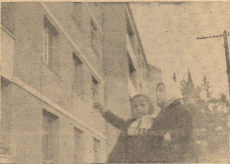
Vrei să ști? Uite acolo locuiesc eu...

Lumina cărții a poposit în casa fiecărui om al muncii din Zlatna și despre timpul stăpînirii burghezo-moșierești cînd pe aceste meleaguri stăruia bezna neștiinței se vorbește din ce în ce mai rar. Le e silă oamenilor de acest trecut.