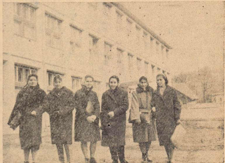
Orele de curs s-au încheiat. IN CLIȘEU: Un grup de eleve în fața minunatei clădiri a Școlii medii din Zlatna.

Munca eroică a celor trei zidari și a celor doi mecanici a fost înununată de succes. Cuptorul a fost reparat, creîndu-se astfel posibilitatea muncitorilor de la sectorul metalurgic al U.M.C. Zlatna de a-și îndeplini planul anual chiar înainte de termen, de a-și respecta angajamentul.