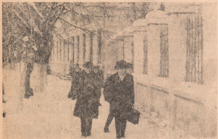
După o vacanță plăcută a început din nou școala.

Ca peste tot în raion, în însuflețite adunări, colectivștii din Mihăi își propun candidați de deputați pe cei mai buni tovarăși, luptători neobosiți pentru înflorirea gospodăriei.