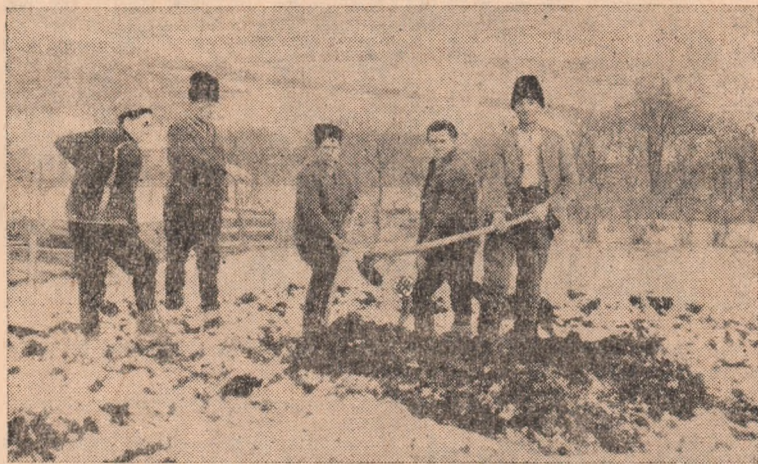
La gospodăria colectivă din Șard iarna nu constituie obstacol. Colectivștii muncesc de zor, fie la defrișarea grădini, fie la întorsul gunoului din răsadnițele vechi, așa cum se vede în clișeu de față.

Sporirea continuă a producției de legume, obținerea produselor de calitate superioară este determinată într-o foarte mare măsură de semintele ce le semănăm, de asigurarea unor soiuri de înaltă productivitate și pe cît posibil timpurii. Multe gospodării din raion își au deja asigurate semintele din producție proprie. Aceasta însă nu scutește nici o gospodărie de a încerca calitatea acestor seminte prin probele de laborator. Din păcate deși nu este un lucru atît de greu abia 3 din gospodăriile colective din raion (Șard, Oarda de Jos și Alba Iulia) au prezentat pînă acum probele de seminte de legume la Laboratorul de seminte din Alba Iulia pentru încercarea puterii de germinare. Această stare de răminere în urmă apare cu atît mai curioasă cu cît unele gospodării colective ca cele din Mihalt, Teius, Cistei, etc., deși sint mari producătoare de legume nici pînă acum n-au trimis probele la laborator. Și sint apoi cazuri cînd în unele gospodării colective însuși aprovizionarea cu seminte este rămasă în urmă. Consiliul agricol raional trebuie să sprijine cu mai multă competență și în mod mai concret conducerea acestor gospodării ca în cel mai scurt timp să se asigure întregul stoc de seminte necesar. Acele gospodării care au surplus de seminte au datoria să ajute și gospodăriile care nu dispun de seminte necesare. De asemenea sectorul agrogrosem Alba Iulia va trebui să urgenceze aprovizionarea magazinului cu seminte, astfel ca gospodăriile colective să se poată aproviziona la timp.