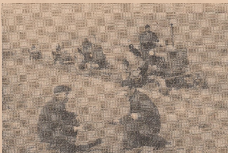
Campania a început. În clișeu: un aspect la controlul calității arăturii la Oarda de Jos.