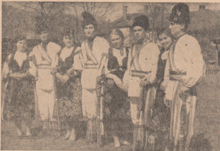
Cîteva clipe înainte de a apare pe scenă. În clișeu: Formația de dansuri a căminului cultural din Valea Dosului.