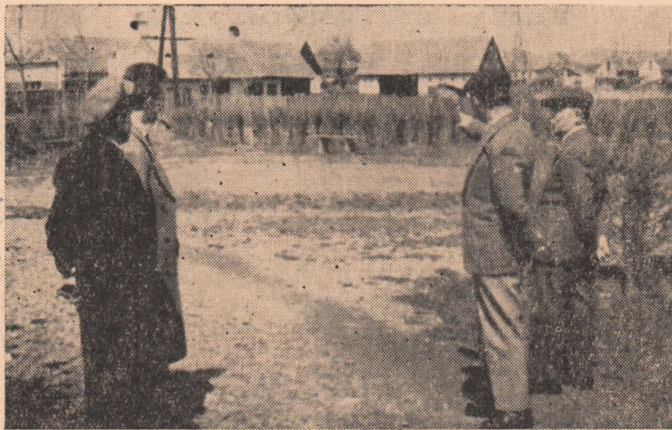
O discuție la fața locului. Cîțiva din membrii grupei de partid de pe strada Morii stabilesc noi măsuri pentru înfrumusețarea străzii lor.

De asemenea s-au stabilit măsuri concrete ce urmează a fi luate pentru mobilizarea masei la înfrumusețarea orașului în cinstea zilei internaționale a oamenilor muncii, ziua de 1 Mai.