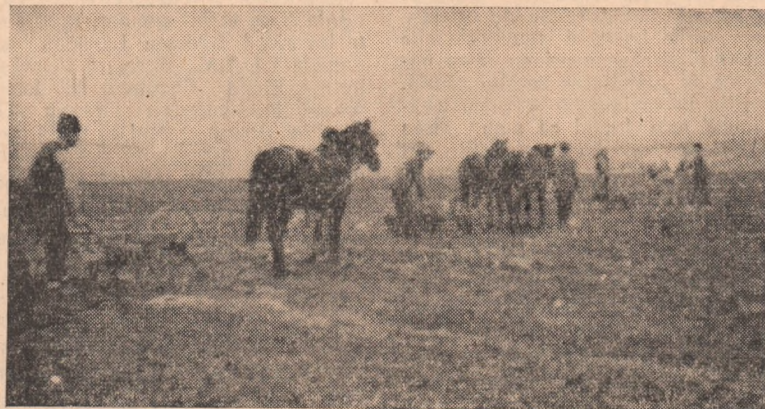
La gospodăria colectivă din Teiuș, dat fiind că terenul este moale și nu se poate însămînța cu tractoarele se folosesc atelajele proprii.