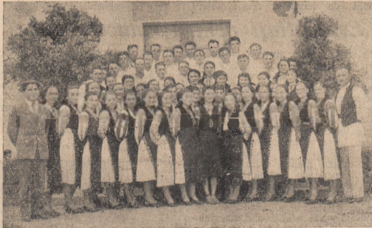
IN CLISEU: Corul colectivităților din Mihail, cunoscut prin bogata activitate.