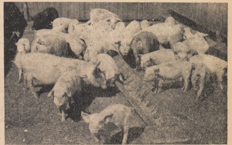
O parte din purcii gospodăriei colective din Teiuș.

Stația meteorologică și de avertizare a manei I.C.H.V. Ighiu-Alba