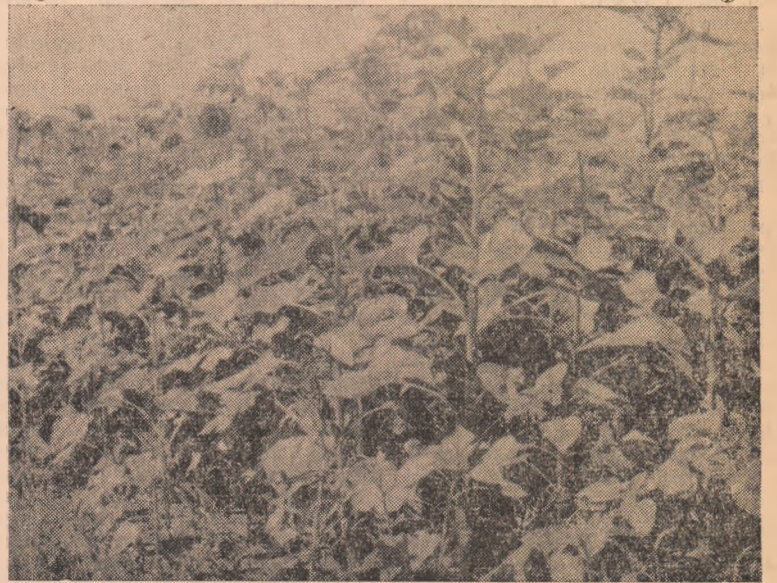
Colectivității din Cricău acordă o atenție deosebită întreținerii în bune condițiuni a tuturor culturilor. Și, după cum se poate vedea din clișeu de față, preocuparea li vădită și în felul cum se prezintă lanul lor de floarea-soarelui.

Hotărîrea colectivității de a obține producții sporite de cereale de pe fiecare hectar, este oglindită de însufleșirea cu care ei lucrează precum și de rezultatele frumoase pe care le obțin în fiecare sector de activitate.