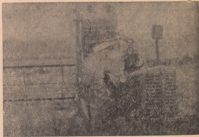
Recoltatul orzului la G.A.S. Oarda de Jos.

Mecanizatori și colectivști! Pășiți cu toate forțele la strîngerea recoltei!