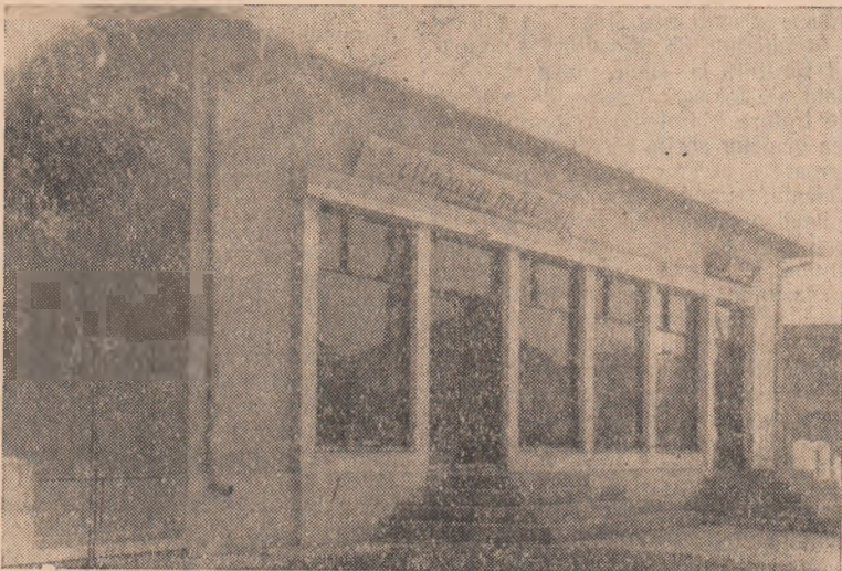
Așa după cum se vede și din clișeu de față, noul magazin constituie o frumoasă realizare pentru cooperativii din Oarda de Jos.

La Oarda de Jos s-a inaugurat de cîteva zile un nou local pentru magazinul și bufetului cooperativei. O nouă realizare a fost înscrisă în cronică de azi a satului.