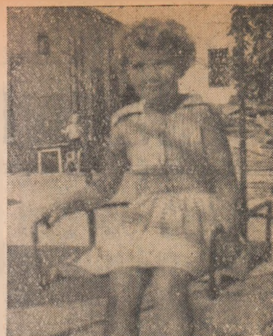
Și leagănul e una din bucuriile copilăriei...

Consiliile de conducere ale gospodăriilor colective și conducerea S.M.T. Alba cu sprijinul organizațiilor de partid și al sfaturilor populare trebuie să ia toate măsurile pentru grăbirea arăturilor adînci, astfel ca nici un hectar să nu rămână nearat.