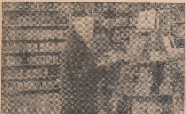
Aprovizionată cu un bogat sortiment de cărți „Librăria noastră” — secția nr. 2, este zilnic vizitată de numeroși oameni ai muncii.

...La cinematograful „Victoria” între 5-8 decembrie a.c. rulează filmul „Ultimul tren din Gun Hill”.