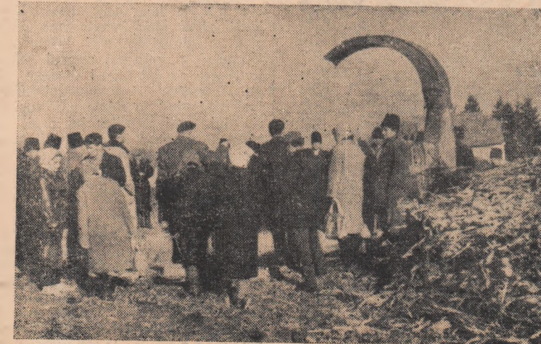
Se execută practic fixarea cuțitelor la tocătoare.

Planul de măsuri mai cuprinde o serie de obiective referitoare la măsurile ce trebuie luate de către fiecare consiliu de conducere al gospodăriei colective pentru creșterea și dezvoltarea continuă a efectivelor de animale, pentru îndeplinirea indicilor prevăzuți în planurile de producție pe anul 1963.