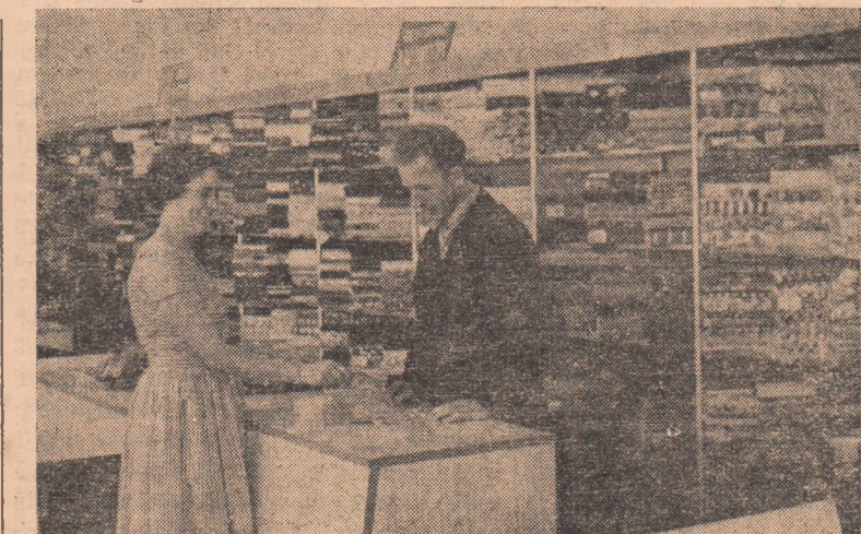
La noul magazin de desfacere din Teiuș, cumpărătorii găsesc din abundență un bogat sortiment de mărfuri.