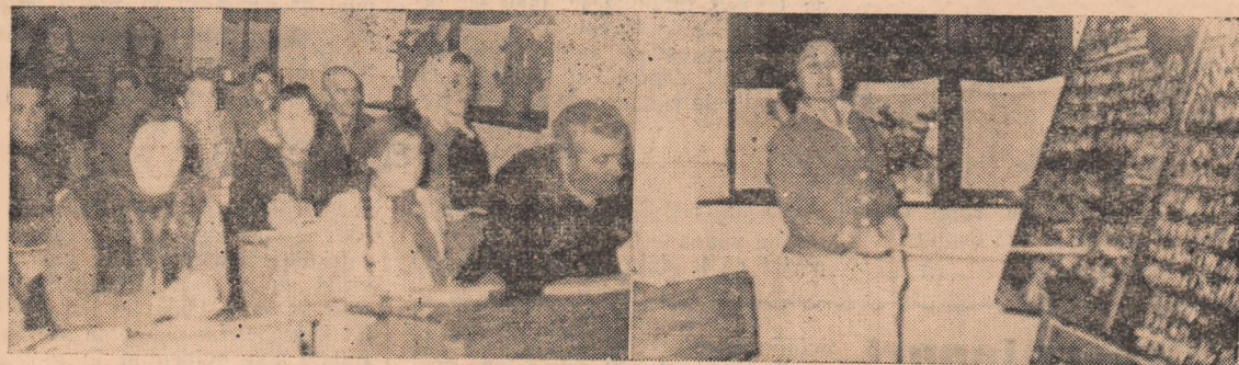
Seară de calcul la Galda de Jos în legătură cu rentabilitatea vacilor de lapte în G. A. C.

Concursul s-a bucurat de un deosebit succes și a constituit un bun prilej de împărtășire a metodelor înaintate de muncă folosite în creșterea și îngrijirea animalelor.