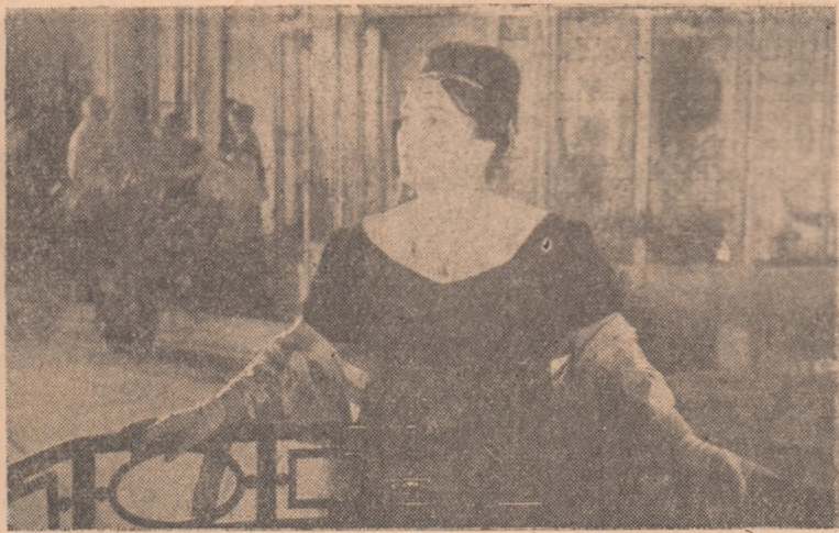
ÎN CLIȘEU: Scenă din filmul românesc „Tudor”.

Animat de dorința fierbinte de a împlini cea de-a XX-a aniversare a eliberării patriei cu noi realizări în muncă, comitetul executiv al cooperativei Hărnia a lansat o însuflită chemare tuturor unităților cooperatiste din raionul nostru ca „în cinstea marelui sărbătorii de la „23 August 1964”, planul pe cele 8 luni ale anului să fie realizat în proporție de 101,5 la sută la toți indicii.