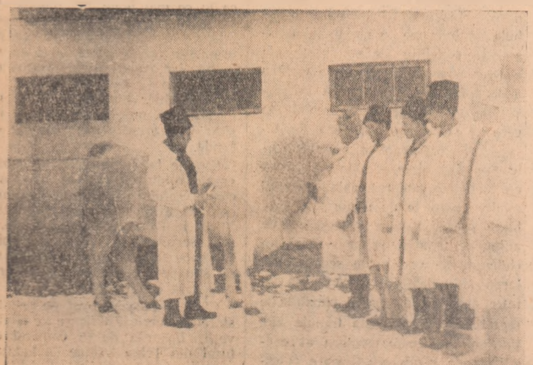
ÎN CLISEU: Un aspect la o lecție practică despre reproducerea taurinelor la G.A.S. Galda de Jos.