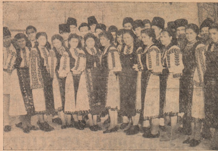
Corul căminului cultural din Ampoita desfășoară o activitate tot mai rodnică. IN CLIȘEU: Corul ampoitenilor gata să urce pe scenă.

Faza interîntreprinderi a concursului al VII-lea, desfășurată la Zlatna, a demonstrat cu tărie că mișcarea artistică de amatori din cadrul celor două unități s-a lărgit, s-a dezvoltat. Cu prilejul concursului însă a reieșit și faptul că atât la U.C.M. cit și la Exploatarea Zlatna sînt încă largi posibilități de a ridica activitatea cultural-educativă de masă și artistică pe trepte și mai înalte, de acest lucru trebuind să țină seama în viitor comitetele sindicale de aici.