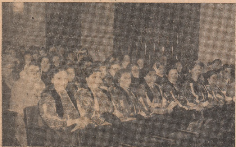
IN CLISEU: Aspect din sală.