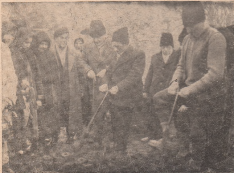
La G.A.C. Micești se lucrează intens la confecționarea cuburilor nutritive.

Și la gospodăria colectivă din Henig se lucrează intens în aceste zile la săpatul gropilor. Pînă la această dată au și fost terminate 1.800 gropi pentru plantarea suprafeței de 7 ha cu pomi.