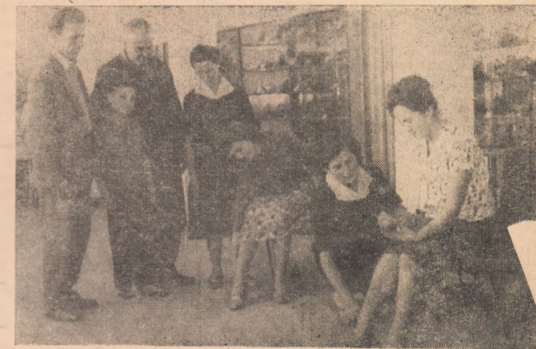
La magazinul de încălțăminte al cooperativei „9 Mai” din Teiuș.