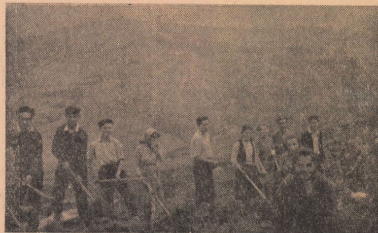
Se muncște de zor la plantatul puieților.