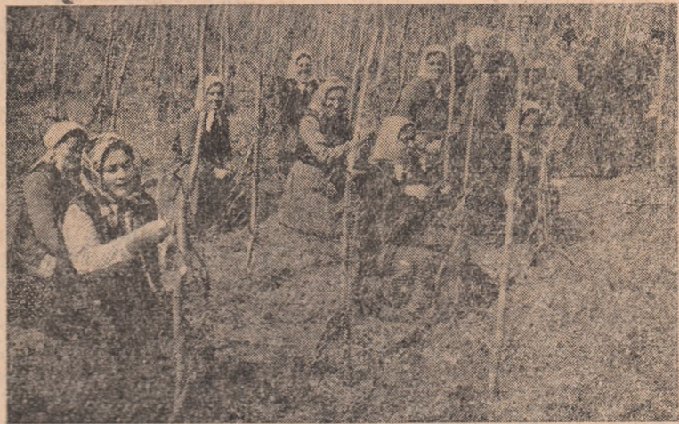
La G.A.C. Cricău, lucrărilor în vii li se acordă toată atenția. IN CLIȘEU: Se muncește de zor la cercuitul viței.

La șirul faptelor și al realizărilor obținute de tinerii de pe șantierul 4 construcții Alba Iulia mai pot fi adăugate încă multe. Ele confirmă dragostea, entuziasmul și elanul cu care tinerii muncesc închinînd victoriile obținute părintelui lor iubit, partidului.