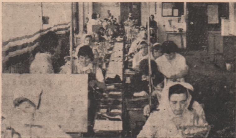
În anii puterii populare fabrica „Ardeleana” din oraș a fost dotată cu utilaj modern. ÎN CLIȘEU: Secția pregălit-cusut.