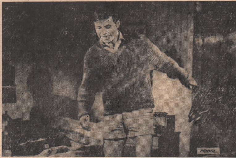
IN CLIȘEU: Scenă din filmul „Podul“.

Rămîne în viață doar unul, cu sufletul zdrobit, cu privirile rătăcite, victimă a unui război monstruos, inuman.