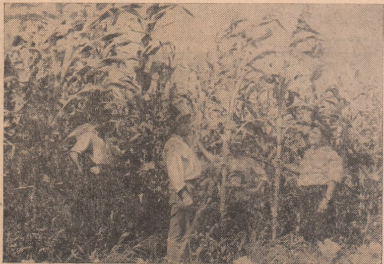
ÎN CLIȘEU: Un aspect de la lotul experimental cultivat cu porumb de înaltă productivitate la G.A.C. Bucurdea Vinoasă.

Pe ogoarele raionului nostru se desfășoară în aceste zile o intensă muncă pentru asigurarea recoltei anului viitor. Mobilizați de către organizațiile de partid, colectivității muncesc de zor la pregătirea terenului și însămînțarea păioaselor de toamnă. Paralel cu aceste importante lucrări, în momentul de față o sarcină tot așa de însemnată este recoltarea și depozitarea culturilor de toamnă. Aceasta cu atât mai mult cu cât o suprafață de peste 590 ha cultivată în prezent cu porumb urmează să fie însămînțată în această toamnă cu grâu. Or a întârzia cu recoltarea porumbului în-