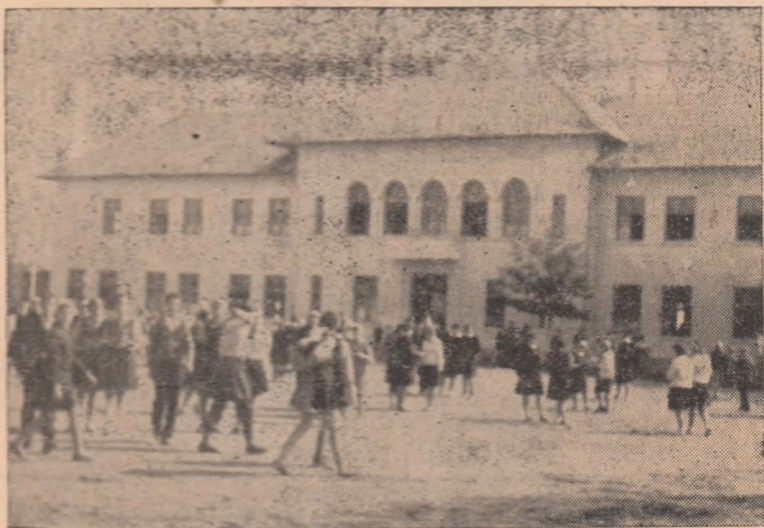
După o oră de muncă la clasă, recreația e deosebit de plăcută.

Orele de curs s-au încheiat. Cu bucuria noilor izbînzii, elevii, învățătorii și profesorii școlii din Teiuș au împințit din nou ulițele comunei. A doua zi însă, ca și în toate zilele ce vor urma din acest an școlar, ei vor fi din nou împreună animați de aceeași hotărîre pentru dobindirea de noi succese la învățătură. Au pentru aceasta asigurate toate condițiile.