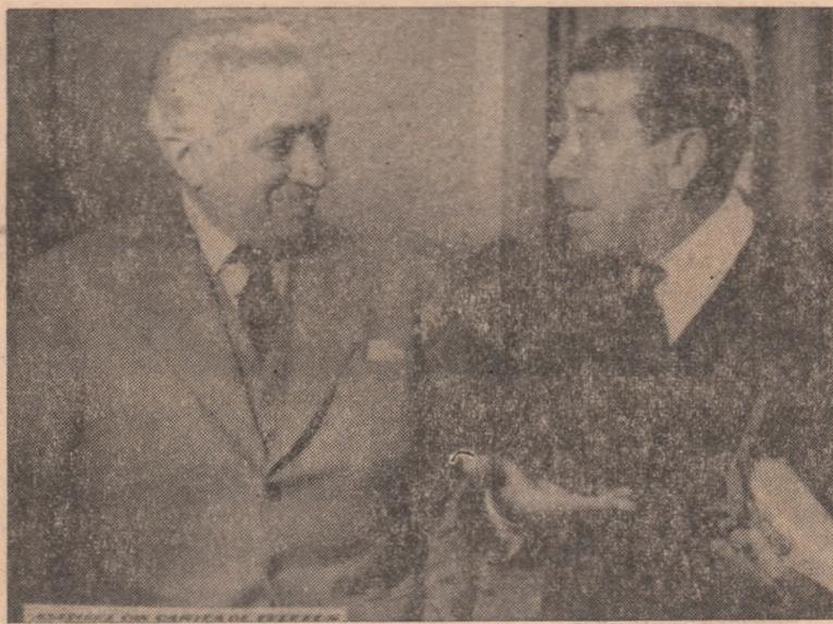
La cinematograful „Victoria” din oraș, rulează începînd de ieri, 1 octombrie a.c., filmul francez „Asasinul din cartea de telefon”. IN CLIȘEU: O scenă din film.