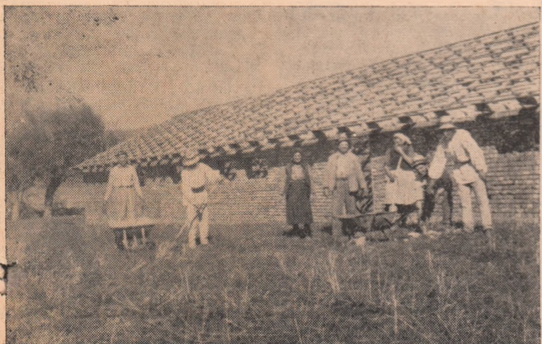
La gospodăria colectivă din Ighiu se lucrează de zor la terminarea unei noi maternități pentru 50 scroafe.