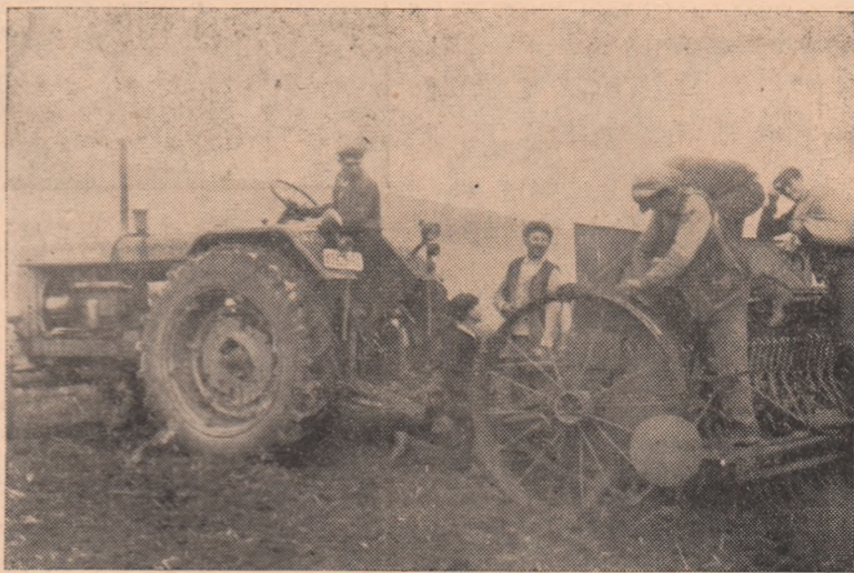
După alimentarea cu sămînță, se va porni din nou la semănatul grîului.

În aceste zile, paralel cu executarea lucrărilor de însămînțări colectivității din Cricău desfășoară o activitate susținută la recoltarea porumbului, transportul cocenilor și pregătirea terenului. Pînă la această dată, ei au recoltat porumbul de pe suprafața de 75 ha și au pregătit terenul în vederea însămînțărilor.