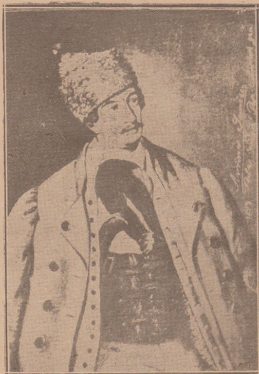
Fig. 1. Avram Iancu,

ale cărei fășii sunt lăsate în jos. Peste cămașe este incins cu un șerpar lat în care sunt înfipte două pistoale și deasupra cămășii are un cojoc de oaie descheiat și peste cojoc o haină scurtă asemenea descheiată. Figura lui este rotundă, nasul și gura potrivite, mustățile mici și răsucite, ochii mari și privirea