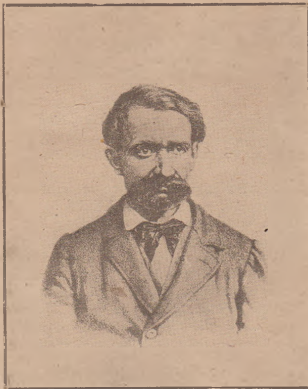
Fig. 6. Avram Iancu în anul 1870.

8. Bust luat în față. 1 Avram Iancu este cu capul gol, părul și mustățile mari, barba mare și neîngrijită. Ca îmbrăcăminte are un palton cu blană încheiat la piept, văzându-se gâtul puțin