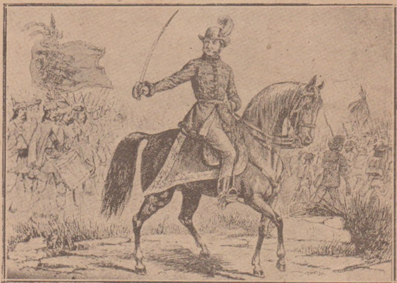
Fig. 3. Avram Iancu în mijlocul moșilor.

nița în spate. După el o altă trupă de Moși în marș cu steag și un toboșar bate marșul. Gravura este o fantezie, dar îmbrăcămintea și figura este identică ca la Nr. 3. Această gravură este reprodusă în mai multe cărți: 1. În «Familia» 1900 Nr. 4 pg. 41, litografie 18×12,5 cm. 2. La începutul broșurei «Biografia lui Avram Iancu» de Iosif Sterca Șuluțiu de Cărpeneș. Sibiu 1897, Zincografie 18×12,5 cm. 3. La începutul volumului «Poezii populare despre Avram Iancu» adunate și