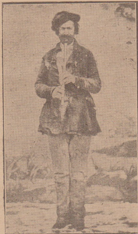
Fig. 7. Avram Iancu în anul 1872.

11. Avram Iancu în întregime luat în față. Este o caricatură în care îl reprezintă cu o pălărie mare pe cap, cu o mână în buzunarul pantalonilor și cu cealaltă se proptește într'un