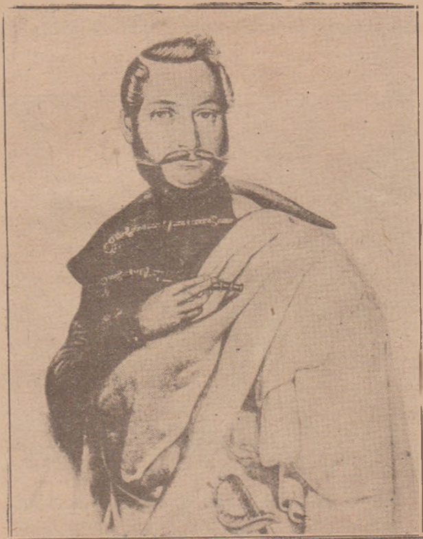
Fig. 2. Avram Iancu,

Cromolitografie 9,5×11,5 cm. făcută după cea de sus. B. A. R. Portrete. Nr. inv. 530.— A. VIII 63).