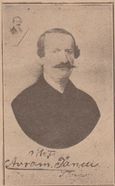
Fig. 4. Avram Iancu în anul 1867.

spune «lancu trăește acum la Abrud; câte odată îl vezi cu o unghiță ce o are mergând pe râul dela Vidra și prinzând pești (așa numiți păstravi) cari apoi îi oferă celui dintâiu amic ce-l întâlnește». 1