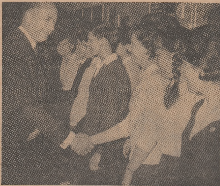
René Maheu, director general al U.N.E.S.C.O., printre elevii unei „școli asociate” din Varșovia.