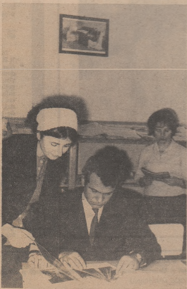
Lectură în biblioteca Casei corpului didactic a județului Alba.