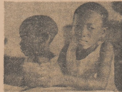
Elevii unei școli elementare din Tanzania

Pe colina Observation Hill, din Dar es Salaam, capitala Republicii Unite Tanzania, se ridică impunătoare siluetele complexului arhitectonic al noii universități tanzaniene. În cadrul universității, care a fost inaugurată la 30 iunie 1970, fiind una din cele mai mari universități din Africa, sînt pregătite cadrele de specialitate necesare dezvoltării tuturor ramurilor economiei naționale.