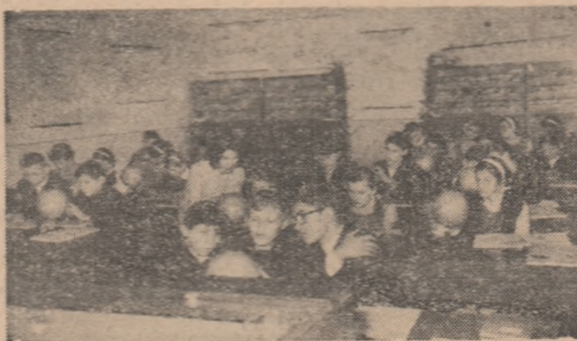
Lecție în cabinetul de geografie al Liceului Nr. 3 din Baia Mare.