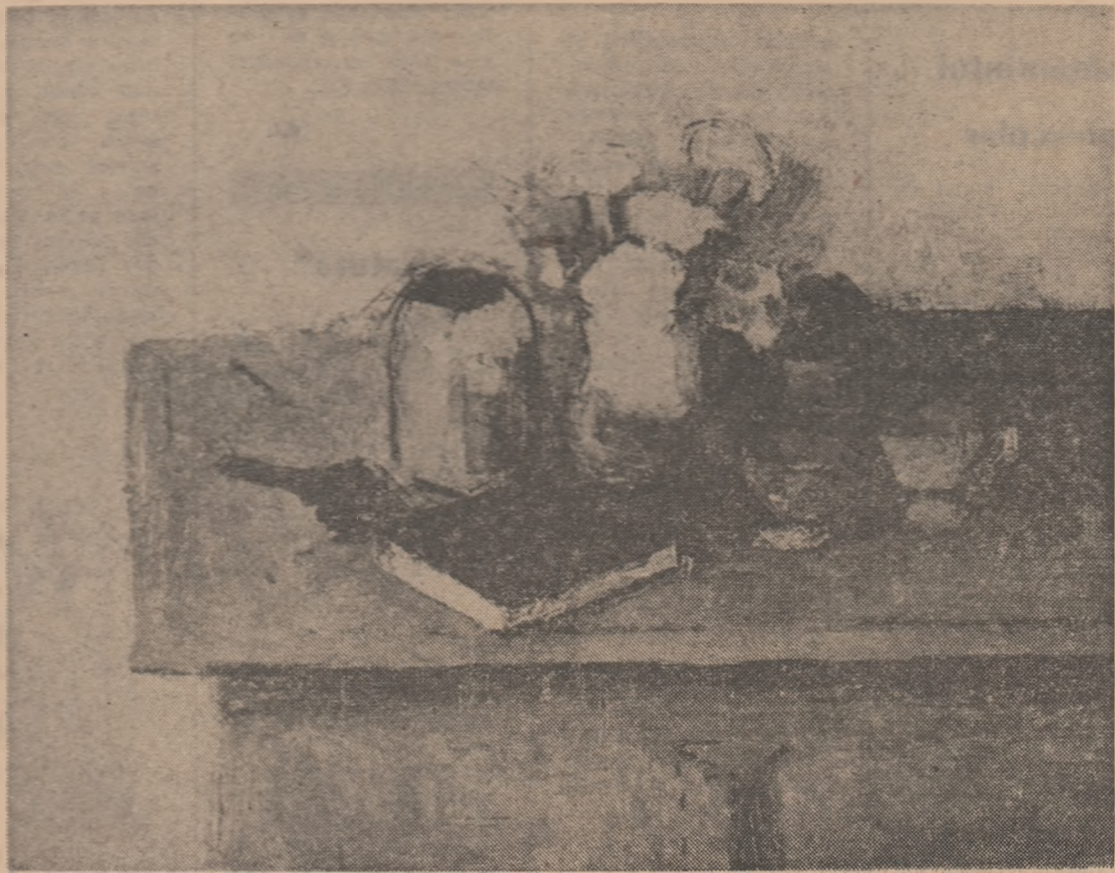
Natură statică cu cană verde