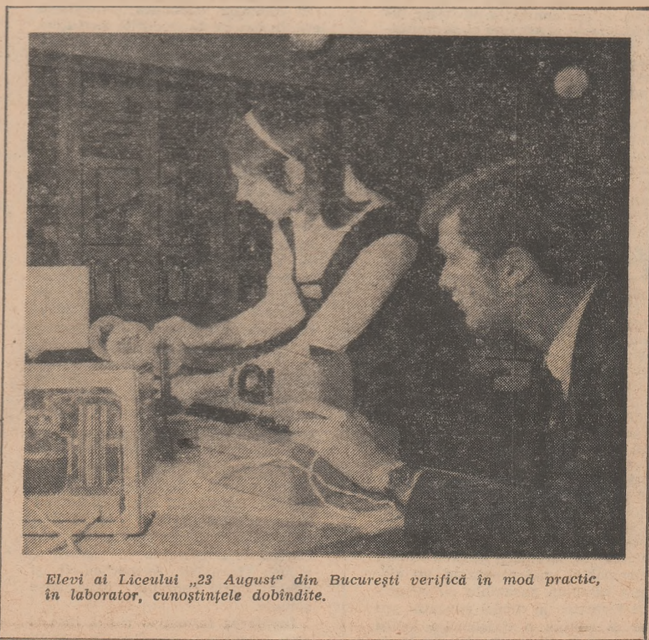
Elevii ai Liceului „23 August“ din București verifică în mod practic, în laborator, cunoștințele dobîndite.

● Un număr impresionant de manifestări cu caracter cultural este prilejuit — în această perioadă — de Semicentenarul U.T.C. Astfel, în această săptămîină la Liceul „Dr. Petru Groza“, cu ocazia sesiunii științifice a elevilor, s-a inaugurat Societatea științifică literar-artistă a elevilor din această școală.