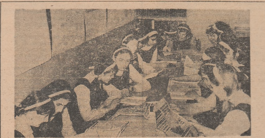
Un grup de elevi la studiul individual