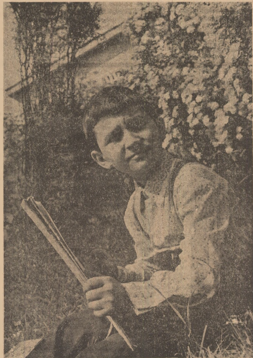
„În natură, după natură”