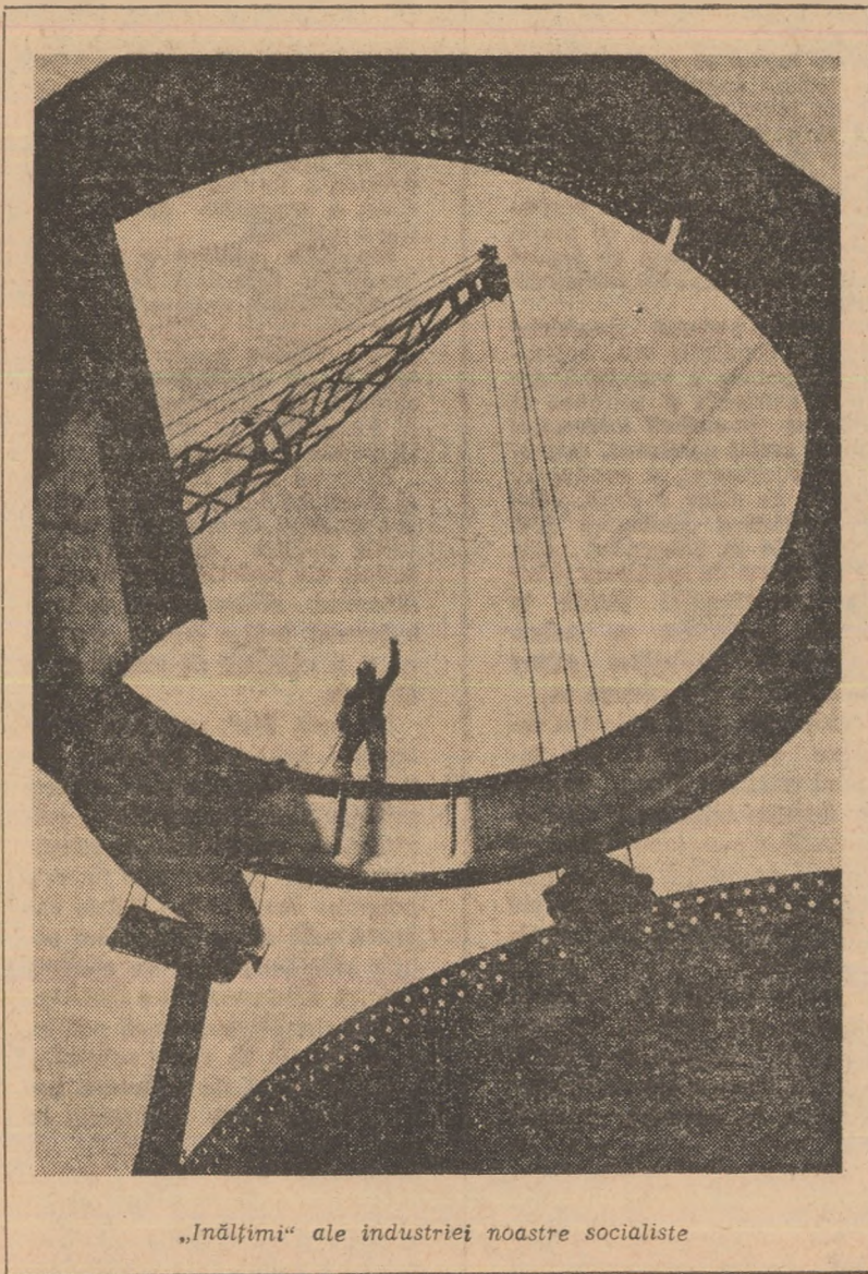
„Înălțimi“ ale industriei noastre socialiste

Nu numai revoluția socialistă poate elimina un asemenea fenomen, alienarea politică. Revoluția socialistă generează astfel o nouă epocă istorică în care mișcarea fenomenului politic suferă transformări radicale,