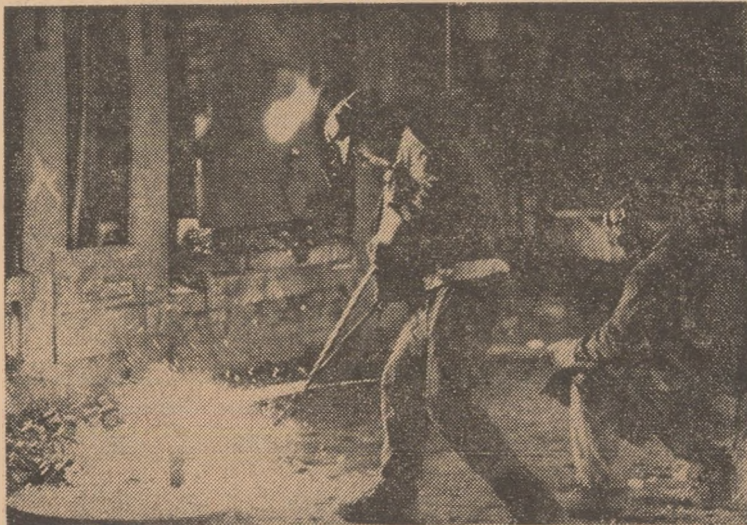
La temperatura înaltă a cuptoarelor se deslușește frumusețea muncii.