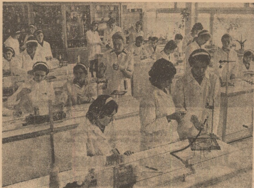
Laboratorul de chimie al Liceului „Lucrețiu Pătrășcanu” din Bacău.

Nu ne putem gîndi la plenara amintită fără să simțim covîrșitoarea importanță a rolului și răspunderii crescute a organizațiilor de partid și de sindicat din învățămînt.