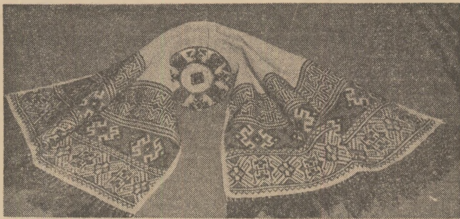
Una din lucrările de artizanat executate de elevele Școlii generale nr. 14 din Brașov.