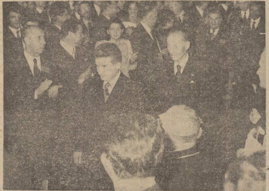
Tovarășul Nicolae Ceaușescu, secretar general al P.C.R., președinte al Consiliului de Stat al Republicii Socialiste România, primit cu puternice aplauze la festivitatea deschiderii celei de a doua Conferințe a miniștrilor educației din țările europene membre ale UNESCO.

Cu prelungirea școlarității obligatorii și democratizarea învățămîntului secundar, pe de o parte, și exigențele educației permanente, care rezultă din însăși evoluția societății europene și, în particular, a modurilor de producție, pe de altă parte, — spunea domnul René Maheu — este de prevăzut că fluxul spre formația postsecundară, și mai ales spre universități, va crește. Dar lărgirea accesului la studiile superioare prin adoptarea unor soluții în funcție de condițiile concrete socio-culturale și materiale ale fiecărei națiuni conducînd — cum au subliniat vorbitorii — la un număr mereu sporit de studenți, implică aspecte noi legate de cheltuielile de școlarizare. Or, atrăgea atenția domnul René Maheu, cheltuielile pentru educație, în special cele pentru învățămîntul superior, sînt deja atât de substanțiale, încît se poate naște întrebarea dacă, în unele cazuri, ele nu au atîns un prag peste care țările ar putea ezita să mai treacă.