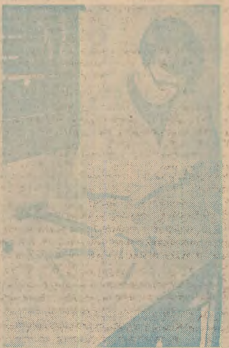
În atelierul de lăcătușărie

Dar exigențele de ordin calitativ pe care le pune societatea noastră au implicatii complexe și sint mult mai mari în comparație cu ceea ce s-a realizat.