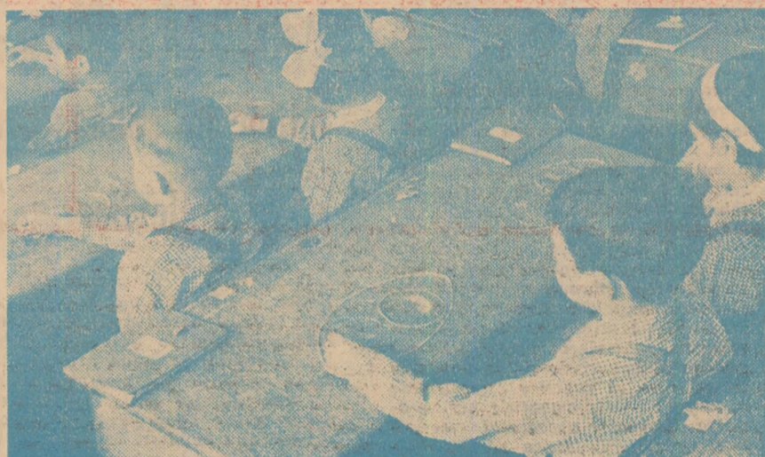
Insușirea matematicii moderne: Teoria mulțimilor cu aplicații practice la Școala generală nr. 97 din Capitală