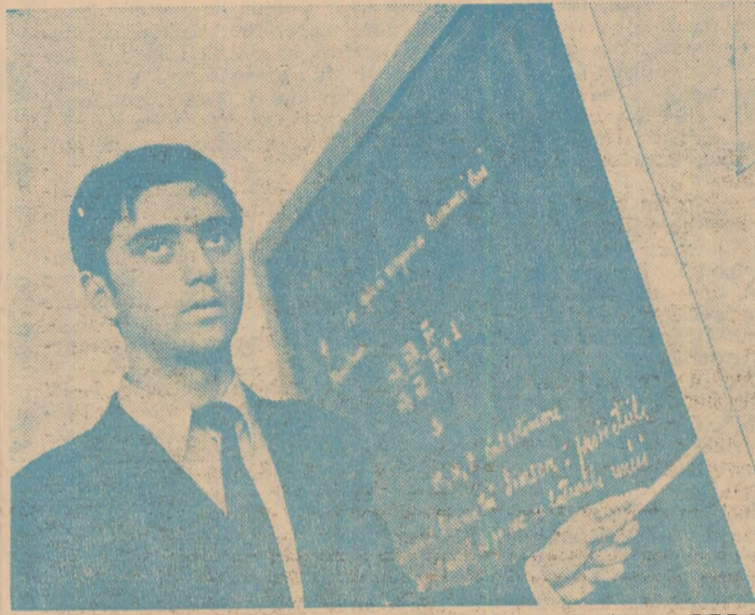
Matematica — prima pasiune