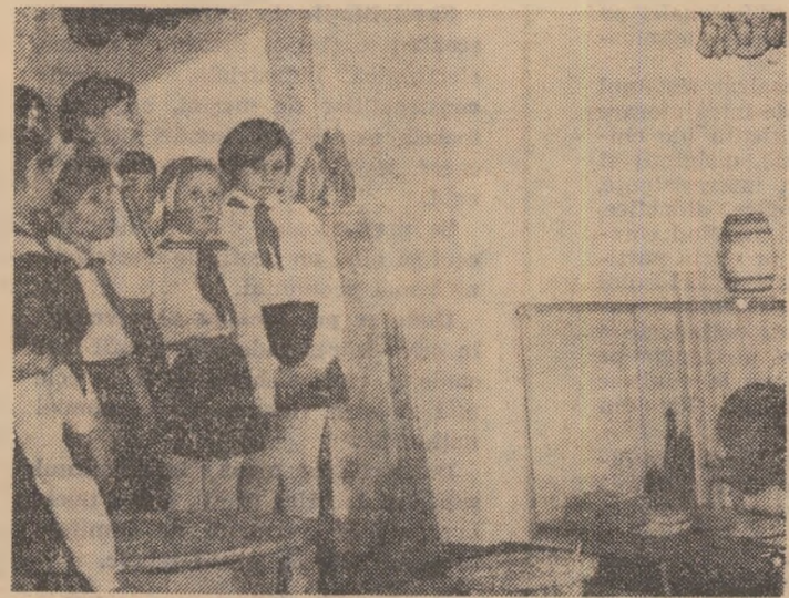
Vizitînd expoziția lucrărilor cercului de sculptură al Casei pionierilor din Iași