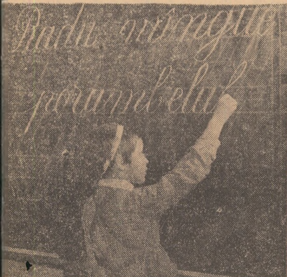
Instantaneu la clasa I

Inv. D. GEORGESCU Școala din Larga, jud. Gorj