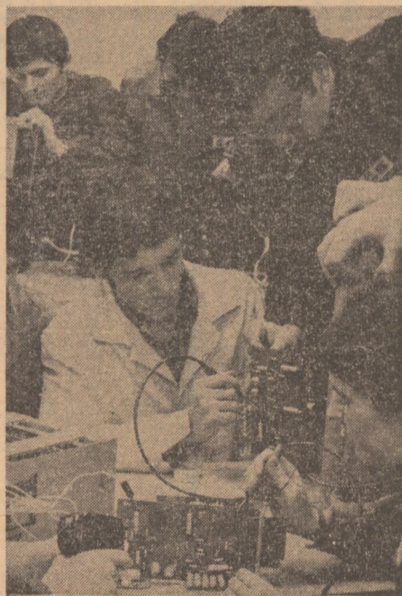
Lucrări practice în laboratorul de fizică