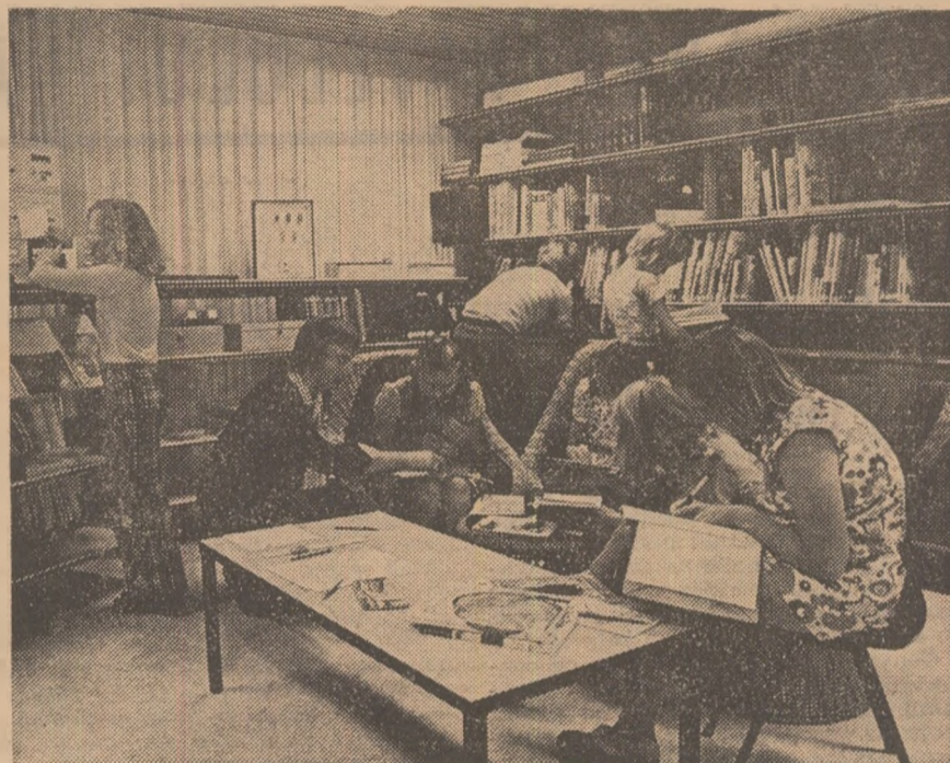
„Noi și marea”, la Sjalomschool

vitare (noul an școlar a început la 15 august) și asistăm la lecția elevilor din clasele a V-a și a VI-a cu tema „Noi și marea”. Cu o zi înainte, elevii au discutat tema cu profesorul lor de științe naturale și au alcătuit un proiect de lucru, împărțindu-se în șapte grupe, fiecare grup avînd cite o subtemă de rezolvat. Printre subteme se aflau: Circulația apei în natură, Ce-ar fi dacă n-am avea apă?, Ploaia care vine din robinet, Marea furioasă, Coastele mării-lor.