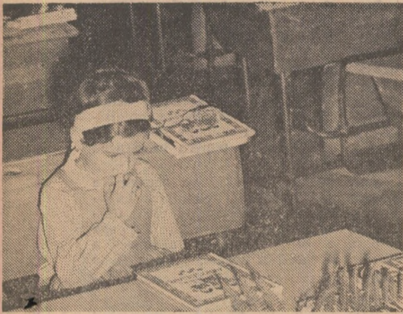
Abecedarul... oare ce taine ascunde ?

că el se datorează, în bună măsură, capacității de efort mai scăzut a elevilor în vîrstă de 6 ani, voi corela în mod organic activitatea de învățare propriu-zisă cu o activitate în completare, de tip școlar, prin jocuri didactice, folosind lucrarea „Culegeri de jocuri didactice pentru clasele I—IV” de C. Popovici și alții.