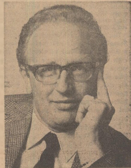
J. A. van Kemenade, ministrul învățământului și științei din Olanda