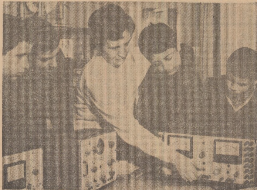
În centrul departamental al tinerilor tehnicieni de la Pleven

Noul sistem de învățămînt va răspunde nu numai nevoilor de azi, dar și celor de mîine. Printr-o profundă reorganizare a sistemului și conținutului învățămîntului, a procesului de studiu, școala se manifestă ca o puternică instituție de educație.