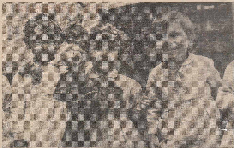
Instantaneu la Grădinița nr. 116 din sectorul I al Capitalei

În zilele de 16 și 17 aprilie s-a desfășurat, la Constanța — sub egida Consiliului județean Constanța al Organizației pionierilor și în cadrul Festivalului național din acest an „Cîntarea României” — încă un simpozion dedicat „Contribuției activităților organizației Șoimii patriei la educarea patriotică, revoluționară a copiilor” . Organizat în două secții — „Forme și modalități de realizare a educației patriotice, revoluționare a copiilor, prin intermediul activităților organizației Șoimii patriei” și „Conlucrarea organizației Șoimii patriei cu ceilalți factori educaționali pentru educarea moral-politică a copiilor” — simpozionul și-a propus — și a reușit în mare măsură — să realizeze o delimitare mai riguroasă, metodologică, a activităților organizației de cele ale programei propriu-zise a activităților din grădiniță și să stabilească variate căi de integrare armonioasă a acestora în programul zilnic al preșcolarilor.