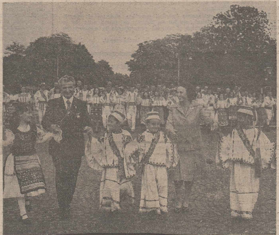
Tovarășul Nicolae Ceaușescu, secretar general al partidului, împreună cu tovarăsa Elena Ceaușescu — prezență scumpă și vie în conștiința și viața copiilor și tineretului patriei noastre