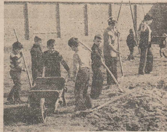
Pionierii de la Școala generală din Nădlac, Vile-Vechi, județul Arad, participă la muncă patriotică pentru amenajarea unui spațiu de joc în curtea grădiniței din localitate