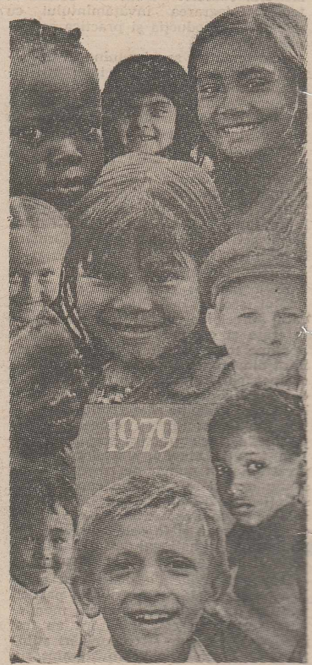
1979 — Anul internațional al copilului propune popoarelor și autorităților de stat eforturi mai mari și realizări concrete pentru asigurarea hranei și științei de carte, pentru apărarea sănătății tuturor copiilor Terrei

dezvoltarea învățământului. Printre obiectivele prioritare se numără: inițierea analfabetismului (populația prezintă 90 la sută femei și 70 la sută bărbați analfabeți), crearea bazei materiale a școlii, pregătirea cadrelor necesare ei și îmbunătățirea conținutului procesului instructiv-educativ, printr-o atentă revizuire și redactare a programelor și manualelor, prin modernizarea metodelor de predare și de evaluare a pregătirii elevilor. Pentru buna funcționare a școlii, autoritățile au rezervat an de an fonduri substanțiale.