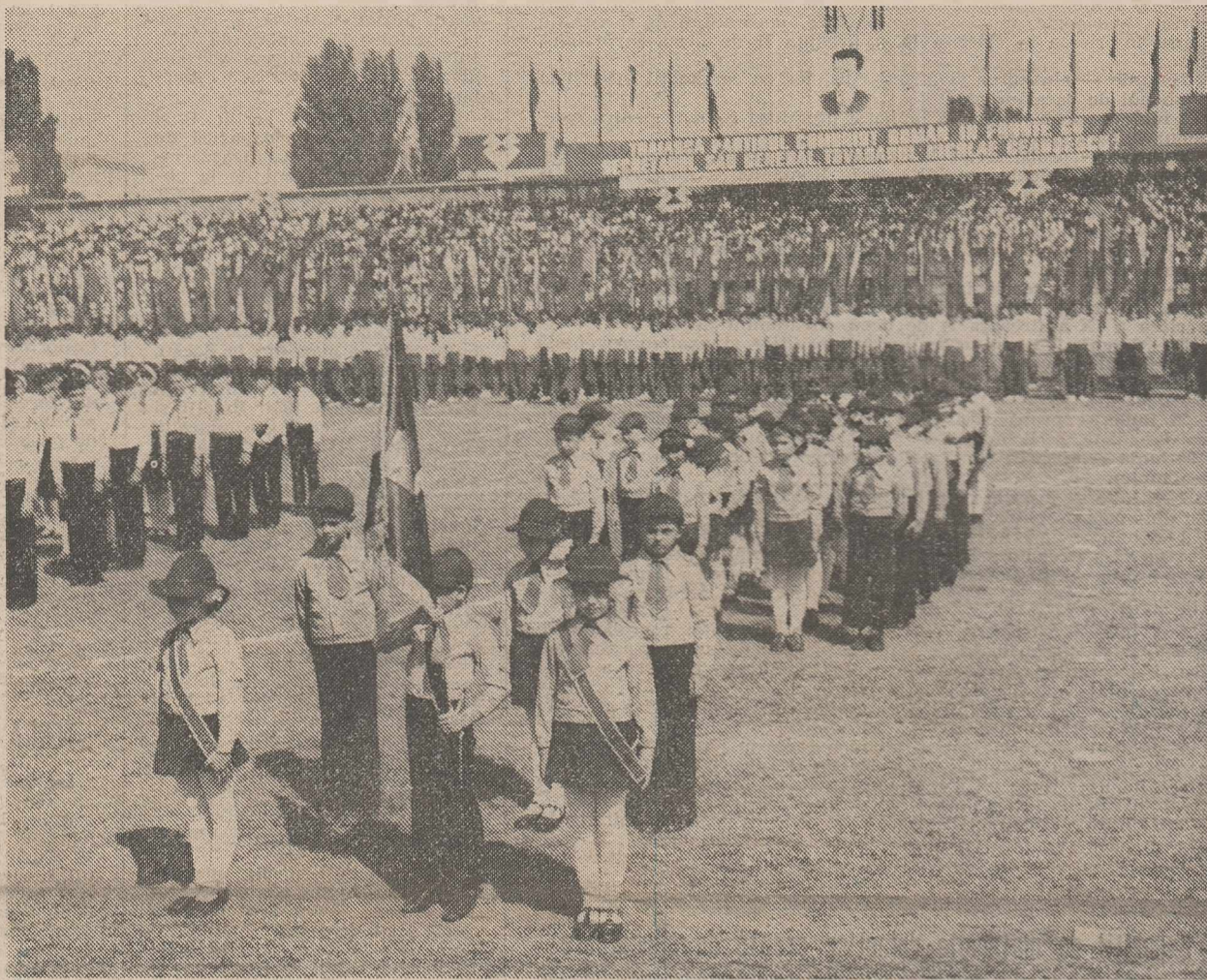
Stadionul Republicii din Capitală a găzduit recent, manifestarea cultural-sportivă a tradiționalei Zile a tineretului din Republica Socialistă România

1 Iunie — ZIUA INTERNAȚIONALĂ A COPILULUI