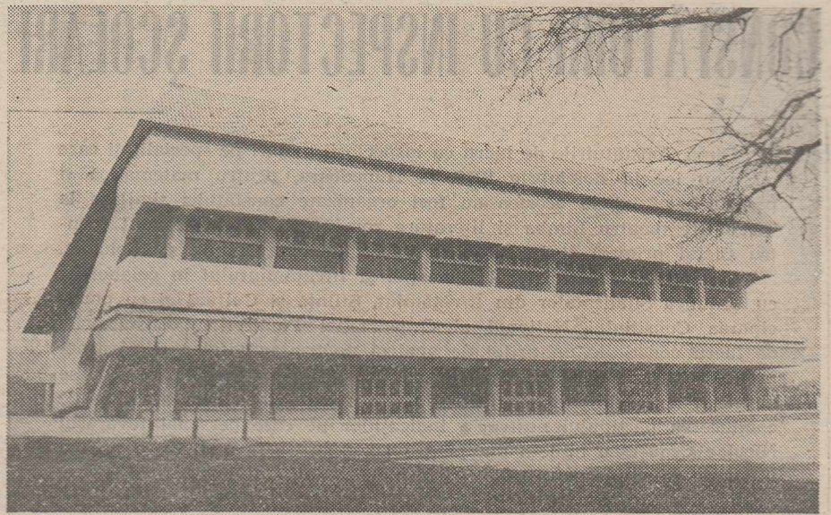
Noua sală a sporturilor din orașul Brașov

redactor, Editura didactică și pedagogică