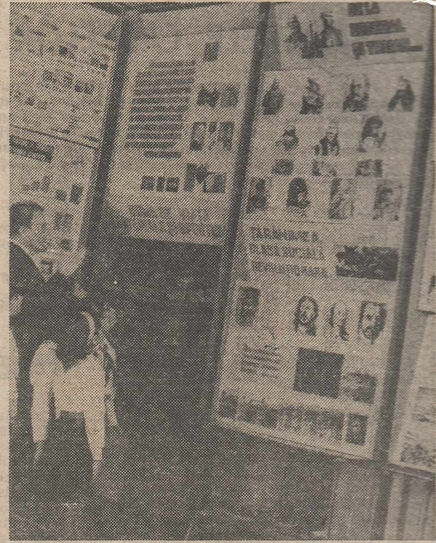
Lecție de istorie a patriei la Casa pionierilor și șoimilor patriei din Iași

În centrul preocupărilor numeroșilor vorbitori s-au aflat, în același timp, problemele ameliorării conținutului învățământului, adaptării lui permanente la