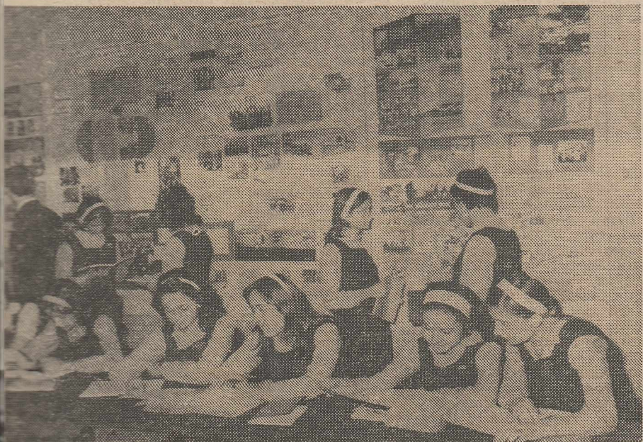
În aceste zile, cabinetele de științe sociale se îmbogățesc cu proiectele documentelor Congresului al XII-lea al Partidului Comunist Român, puse în dezbaterile întregului nostru popor

Educ. METTA REIN Grădinița nr. 10 din Sibiu