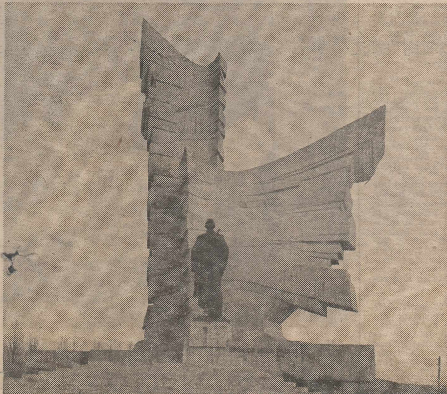
Monumentul eroilor din Păuliș, județul Arad, un omagiu adus ostașilor români căzuți pentru eliberarea patriei