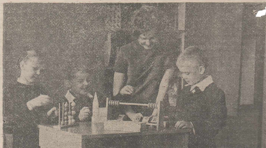
U.R.S.S. — Noi mijloace de învățămînt într-un cabinet școlar pentru clasa I

inspectori în Direcția de Îndrumare și Control a Ministerului Educației din Republica Cuba