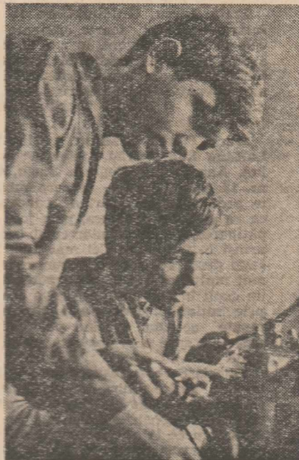
La practică în atelierul de lăcătușărie

„Seralul” Liceului „Al. Sahia” din București este servit de un colectiv profesoral de calitate, în care predomină numărul celor cu gradele I și II, cu mulți ani de experiență la catedră, uneori efectuată numai la acest gen de învățămînt, al celor care „au ce spune” în profesia lor (și aici este, poate, semnificativ faptul că televiziunea se ajută de această școală și de profesorii ei pentru înregistrarea emisiunilor privind predarea matematicii și fizicii la seral).