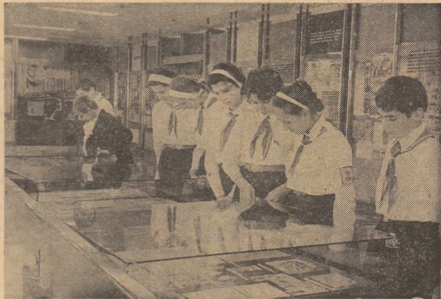
In aceste zile, în Capitală, la Muzeul de istorie a Partidului Comunist, a mișcării revoluționare și democratice din România elevii învață cu emoție și cu sentimente de înaltă prețuire, din mărturiile autentice ale eroismului clasei muncitoare, al comuniștilor.