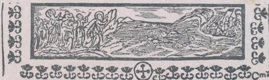
din Dosofteiu, Viața Sfinților , Iași, 1682.

Dar dacă am insistat asupra acestei lature cultural-utilitare a acestui fel de opere, nu înseamnă că vorbind de „Viețile Sfinților” a căror publicare au întreprins-o d-nii Sadoveanu și Pătrășcanu, nu vom aminti și despre frumoasele însușiri literare, care se întâlnesc, cum e și firesc, în mai mare măsură în partea de colaborare a d-lui Sadoveanu. În acest volum, deci în bucățile: „Sfintele amintiri”, „Minunea Teoctistei Lesvianca”; „Fericita Cecilie” și mai ales în „Istoria sfinților Varlaam, și Iosaf dela India”, în care d. Sadoveanu toarnă peste aroma