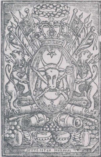
STEMA MOLDOVEI din Viețile Sfinților din luna Martie, M-rea Neamțului, 1813.

Iată de pildă pe Avenir, împăratul, tatăl lui Ioasaf, tulburat de biruințele duhului creștin: „Fiind în mare nedumerire și clătindu-se cu gândul pentru adevărul credinței vechi, stătea în cumpănă ca între două nopți” sau iată pe frumoasa Mogra tulburând statornicia sufletească a lui Ioasaf: „A apărut lui Ioasaf așa de frumoasă și atât de plină de înțelepciune, încât n'o putea privi și asculta fără tulburare. Ceasurile de seară mai ales, când începeau a juca în întunecime licuricii sburătorii și cântau dulce fântânile, i se păruă doadață pline de un farmec pe care nu-l cunoștea. Fecioare mlădioase veneau în foșorul unde sta și începeau danșuri așa de line și ușoare încât parcă erau purtate de valurile lor în aburirile vântului...”