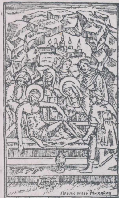
Gravură din Viețile Sfinților din luna Martie , M-rea Neamțului, 1813.

când nu numai nu miluești pre sărac, ci și ce are îi răpești, — atunce sufletul tău iaste mort cu totu de spre faptele bune aceste, care prin cetirea dumnezeestilor scripturi să lucrează, și să cresc și să daog. Pentru aciasta vă rugăm și vă în-