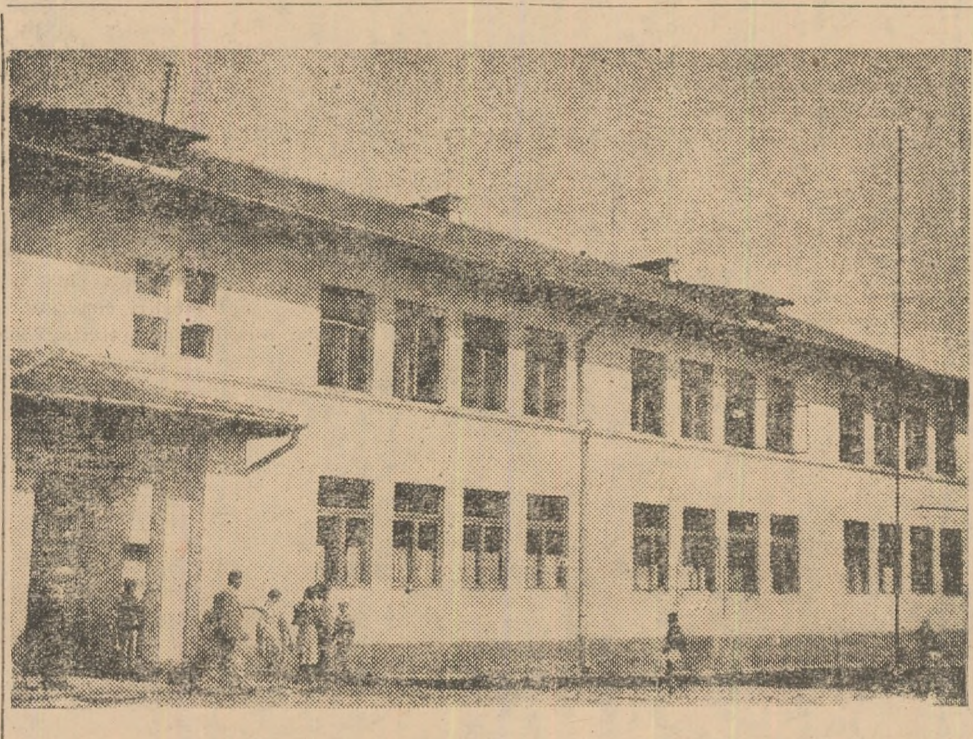
În foto: Școala medie de 10 ani din orașul muncitoresc Hunedoara.