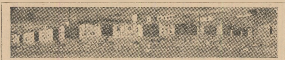
În foto: aspect din orașul muncitoresc Hunedoara (locuințe muncitorești).