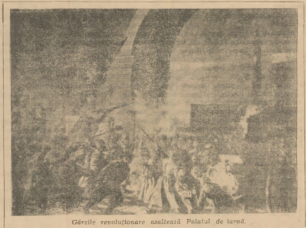
Gărzile revoluționare asaltează Palatul de Iarnă.

Alături de Lenin, muncea neobosit cel mai devotat și apropiat tovarăș al său de luptă I. V. Stalin. El se găsea în centrul întregii activități practice a partidului, lua parte directă la conducerea activității Comitetului din Petrograd al partidului, conducea „Pravda”, scria numeroase articole atît în „Pravda” cît și în „Soldatskaia Pravda” îndrumînd activitatea bolșevicilor în cursul campaniei municipale din Petrograd. Alături de Lenin, Stalin participă la lucrările Conferinței pe întreaga Rusie a organizațiilor militare ale partidului și organizează demonstrația istorică de la 18 iunie (1 iulie) care desfășurîndu-se sub lozincile partidului bolșevic, a constituit o adevărată trecere în revistă a forțelor partidului. După acest eveniment, menșevicii și socialiștii-revoluționari în cîrdășie cu burghezia și cu generalii gărzilor albe, s-au năpustit cu furie asupra partidului bolșevic devastînd localul redacției „Pravda” și a altor ziare pe care le-au interzis apoi, arestînd mai mulți militanți de vază ai partidului și