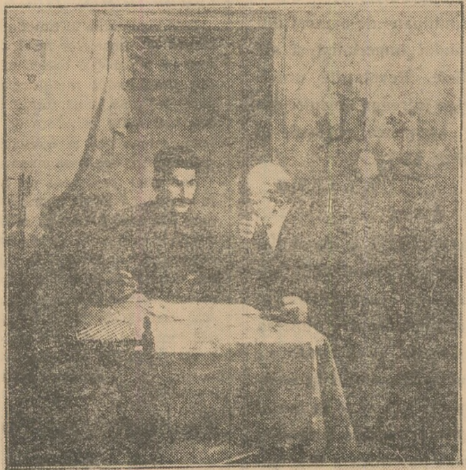
Lenin și Stalin discută problemele revoluției.