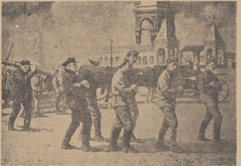
Lenin ia parte activă la primele subotnice