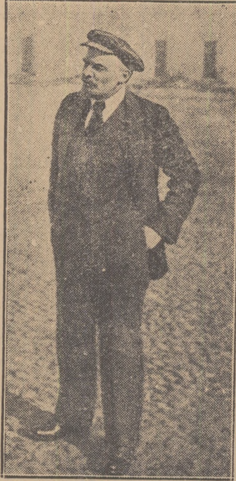
Lenin în Kremlin după revoluție

Vizitarea acestor locuri scumpe oamenilor simpli din lumea întreagă, asemenea unui izvor dătător de viață, le umple inimile de un curaj inepuizabil, de încredere fermă în viitorul luminos al omenirii.