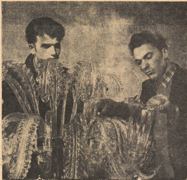
Pe șantierul complexului club-cinematograf se desfășoară o muncă intensă pentru darea lui în folosință în cinstea zilei de 1 Mai.

Publicăm mai jos unele metode folosite de propagandiști în această direcție: