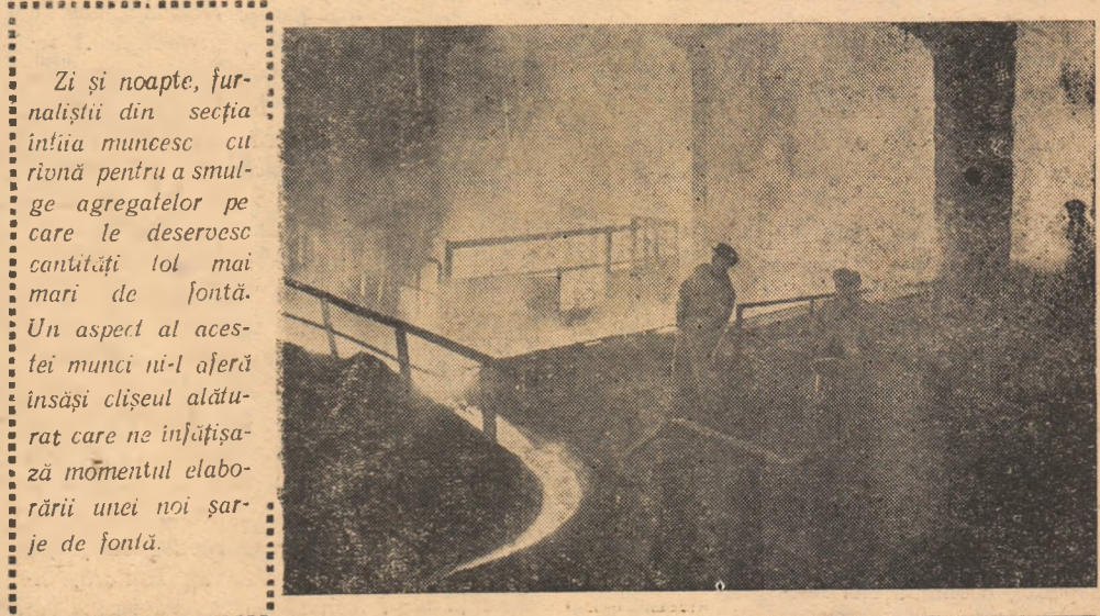
Zi și noapte, furnaliștii din secția întâia muncesc cu rîvnă pentru a smulge agregatelor pe care le deservește cantități tot mai mari de fontă. Un aspect al acestei munci ni-l așera însăși clișeu alăturat care ne înfățișază momentul elaborării unei noi șarje de fontă.