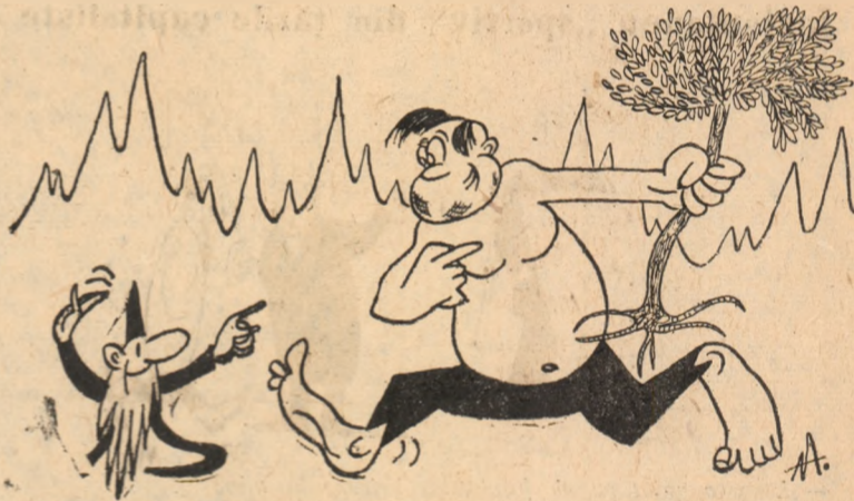
Statu-palmă-barbă-cot către Strîmbă-lemne:

racotă), sînt încălzite printr-o singură sursă producătoare de căldură: încălzire centrală.