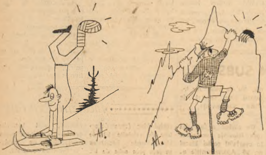
Instantaneu „sportiv” din țările capitaliste