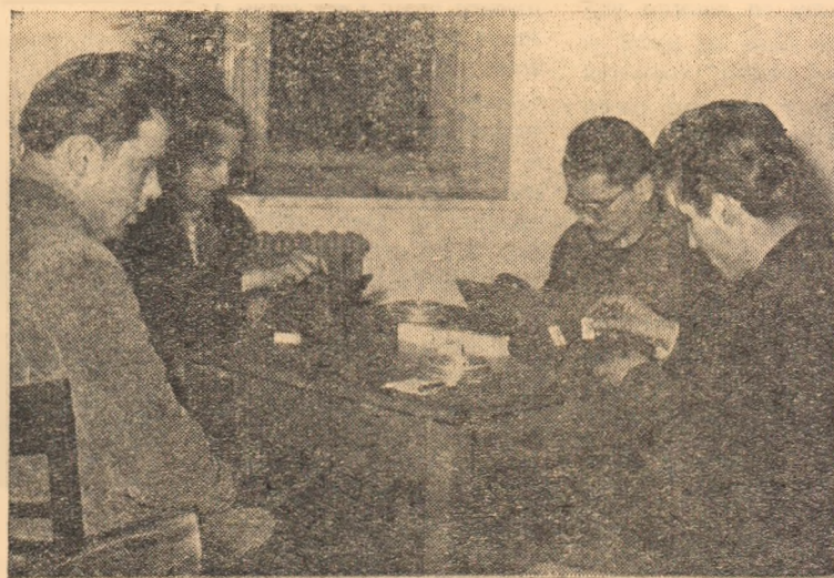
Siderurgiștii și constructorii hunedoreni își petrec timpul liber destul de fructuos, în cluburile și bibliotecile care le sînt puse la dispoziție. În foto: aspect din sala clubului Alexandru Sahia.

...Și așa discuțiile n-au conținut nu numai în magazine ci și pe străzi, în autobuse, fiecare hunedorean mărturisind sincer dragostea și recunoștința față de partidul nostru care ne conduce pe drumul unei vieți tot mai fericite.