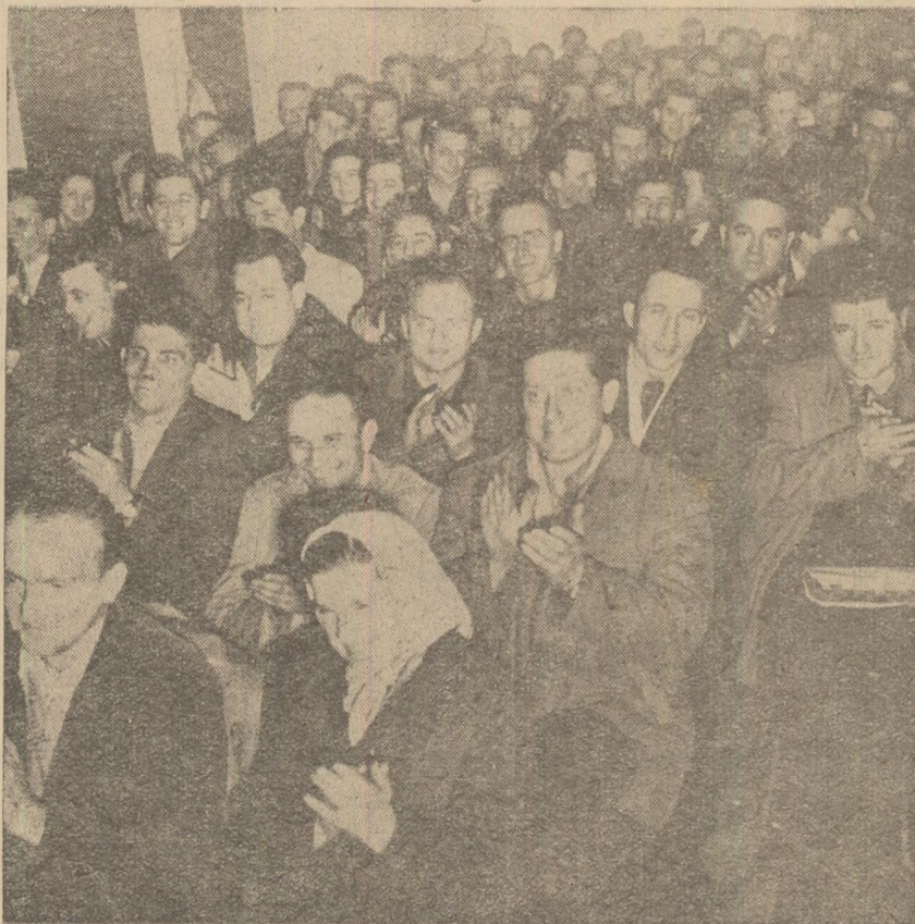
Sîmbătă după-amiază tovarășul Alexandru Drăghici s-a întâlnit în sala C.F.U. a combinatului siderurgic Hunedoara cu numeroși furnaliști, oțelari, laminatori.

Cea mai mare parte a obiectivelor vizitate au fost date în exploatare începînd din anul 1956, deci în perioada de timp care a trecut de la ultimele alegeri. Munca avîntată a oțelariilor, laminatorilor, a făcut ca în acești ani producția de fontă să crească de 1,88 ori, de oțel de 3,82 ori, de laminate de 7,69 ori, de cocs de 4,82 ori, cifrele acestea dovedind dorința fierbinte a oamenilor de a răspunde de în acest fel necontenit