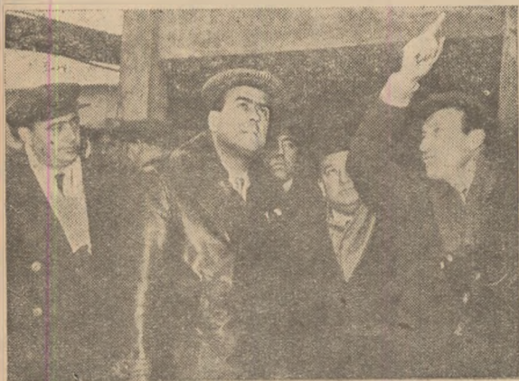
În timpul vizitei întreprinse în orașul nostru și a întâlnirilor pe care le-a avut cu oamenii muncii tovarășul Alexandru Drăghici s-a oprit și la semi-cocseriea uzinei „Victoria” Călan.

Construcție nouă, înfăptuire a regimului democratic popular, semi-cocseriea din Călan asigură o bună parte a materiei prime necesară pentru elaborarea șarjelor de cocs la marele combinat hunedorean. Muncitorii din această secție frunză a uzinei Victoria obțin frumoase rezultate în muncă, luptînd necontenit pentru o productivitate sporită a agregatelor, pentru o producție de calitate mereu îmbunătățită.