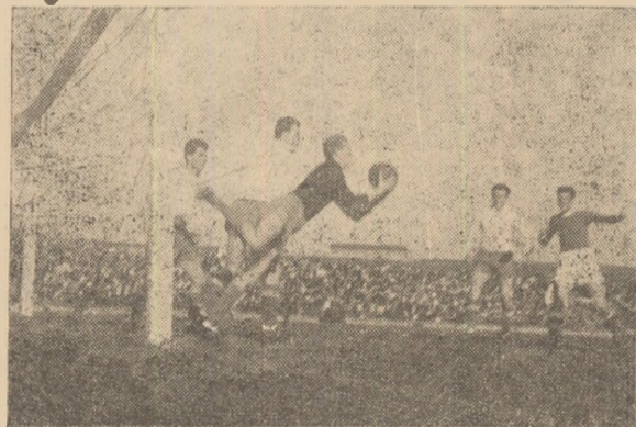
Faza de la meciul de fotbal dintre Corvinul și Petrolul ce a avut loc în etapa 17-a a Categoriei A.