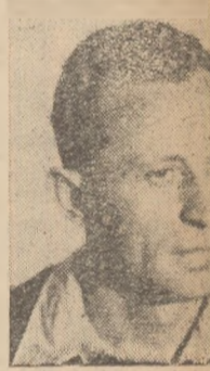
BETUS TANAS macaragiu