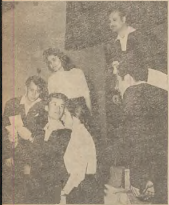
La cel de al VI-lea concurs al formațiilor artistice — faza orașenească — a participat și brigada artistică de agitație a combinatului. În foto: aspect din prezentarea programului pe scena clubului muncitoresc din Călan.