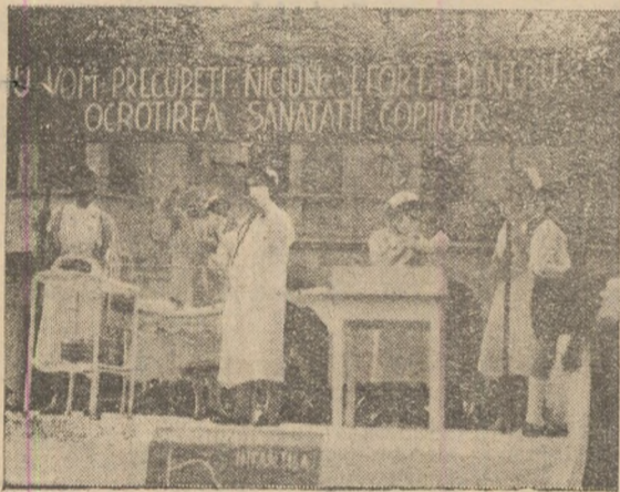
Carul alegoric al Spitalului Unificat

tribunei și muncitorii din celelalte secții, care la rîndul lor poartă panouri uriașe, pe care sînt înscrise succesele obținute în cîntecul acestui eveniment. De pildă furnaliștii secției a II-a în cele 4 luni de la începutul anului au produs aproape 8.350 tone tonță peste plan. Oțelarii raportează și ei în această zi de sărbătoare obținerea unor deosebite succese.