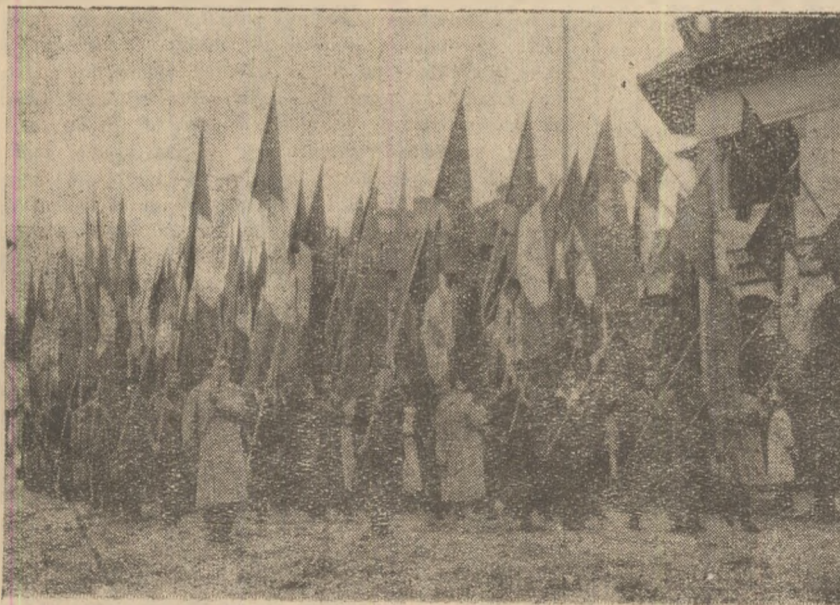
ASPECT DIN TIMPUL DEMONSTRATIEI.

Primate cu puternice aplauze, în piață pășesc, detașamentele gărzilor muncitorești, alcătuite din muncitori, care poartă uniforme cenușiu-albastrii, cu banderole