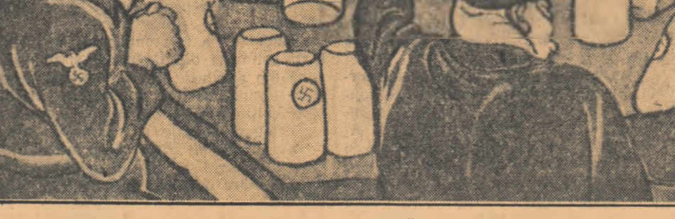
Desen de B. EFIMOV