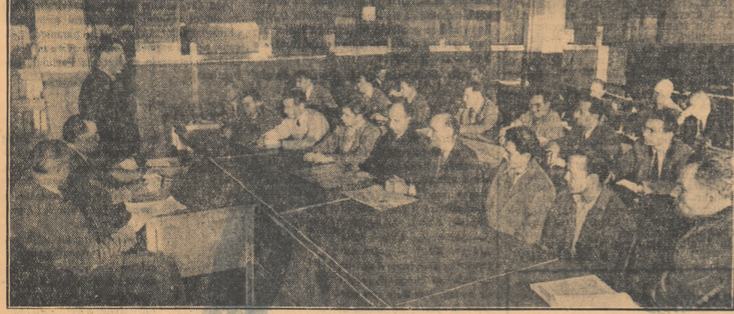
Cu prilejul „Zilelor tehnicii sovietice”, au avut loc în întreprinderi numeroase consfătuiri, schimburi de experiență și demonstrații practice cu privire la aplicarea metodelor de muncă sovietice. În clișeu: un aspect de la constătuirea organizată cu această ocazie la întreprinderea „Electromagnetica” din Capitală.