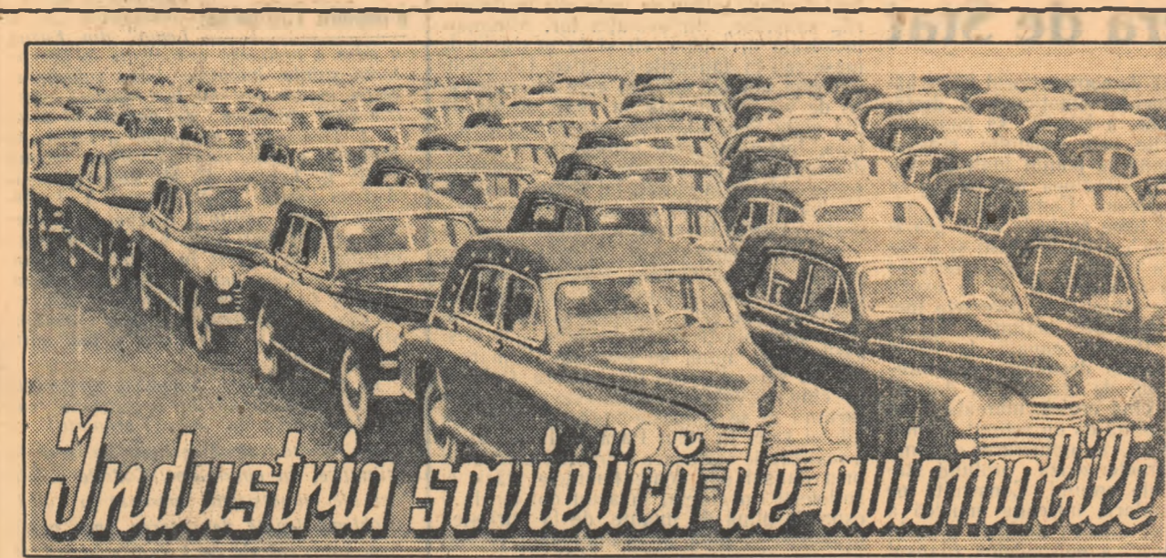
Industria sovietică de automobile